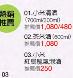
03. 小米紅烏龍氣泡酒 推薦價250