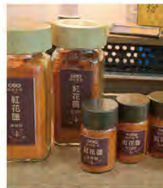
花辣粉 特價180 原價200

成立於1946年三代傳承，以蜂蜜堅持不加工濃縮脫水，只採取天然蜂蜜(生蜜、封蓋蜜)，堅持原則是信譽並負責任。