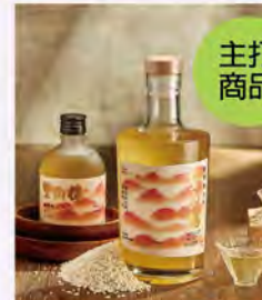
01. 小米清酒 (700ml/300ml) 推薦價1,080/480

望山糖之經典酒款，使用花蓮光復有友善種植小米，結合日本清酒釀造之工藝技術，過程小米反覆網篩、洗滌、浸泡、蒸煮、釀造、沈澱、過濾，才能得到清澈如琥珀色，彷彿大自然饋贈的小米清酒，其中更包含「望哩順遂」之美意。