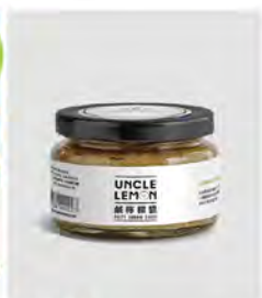
純檸檬磚 特價339 原價480