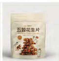
五穀花生片 推薦價220