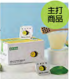
蜂蜜檸檬風味膠囊 特價399 原價559

創立於2018年的台灣人氣檸檬品牌，以屏東九如的在地優利卡(四季)檸檬為核心，主打「連皮帶籽冷壓榨汁、100%無添加」的常溫檸檬磚。