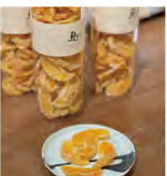
島·小桶柑 特價399/瓶 原價480/瓶

主打68種外銷級精品果乾，堅持無添加化學糖與色素，透過獨家三段式烘焙技術封存食材原味，展現台灣精品果乾的極致質感與純粹魅力。