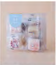
綜合花果糖磚 推薦價200/盒

專注於將台灣各地特色水果透過細膩的手工製作，並揉和地酒、香料、香草、蜂蜜等，讓台灣島嶼美好的果物走入每個人的餐桌生活裡。