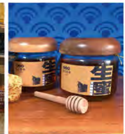
天然龍眼生蜂蜜(封蓋蜜、熟成蜜) 推薦價650