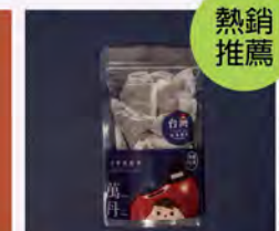
手作紅豆茶 特價500/3包 原價180/包