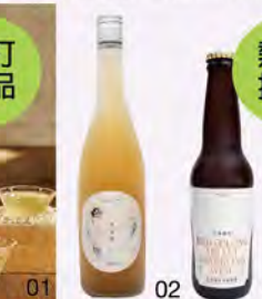
02. 茶米酒 (600ml) 推薦價1,080