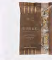
無二松子桂花糕 特價413 原價470