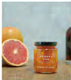
柴焙龍眼琴酒葡萄柚果醬 推薦價350/罐