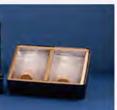
法式小圓餅禮盒-人氣綜合24入 推薦價500