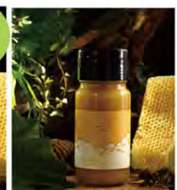
淡麗玉桂蜜750g 特價880 原價1,080