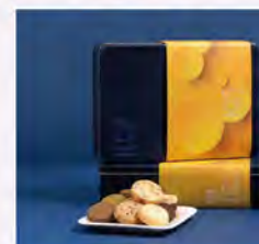
法式大圓餅禮盒20入 推薦價650

以正統法式工藝結合台灣在地食材，每一塊甜點都是日常裡的小儀式。純手工、天然無添加、減糖配方，當日現烤現包裝，讓層次與滋味在口中綻放，如同幸福在舌尖盛開。