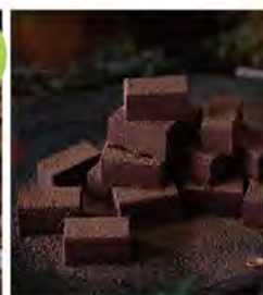
原味生巧克力 推薦價680