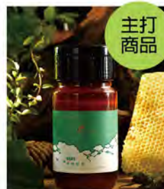
檸檬群叢蜜750g 特價880 原價1,080

位於南投魚池五城村蓮華池研究中心，是蜜蜂理想的居所。純淨無汙染的環境，讓蜜蜂能隨四季花期採集多樣花蜜與花粉，釀出風味獨特的森林蜜。