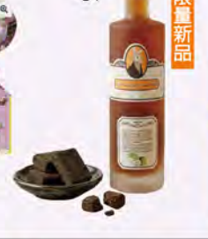
01. 冬桂桂花酒700ml 推薦價699