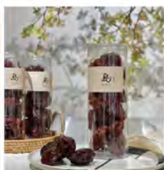
島·牛番茄乾 特價399/瓶 原價480/瓶