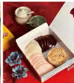
三色片沾麻糬(6個/15個) 推薦價100/200