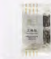
無二芝麻糕 特價255 原價290

源於初心，真實無二，世界級的養生中式點心。創造無二系列產品為中式點心立下國際標準，提供養身、養心、養意的無二口感。全系列嚴選高品質的天然原料，堅持無添加理念，由職人手藝打造市場上獨一無二，頂級中式點心品牌。