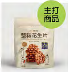
整粒花生片(原味) 推薦價220

三代堅持傳統工藝，讓經典花生糖不僅溫暖日常，也獲國際肯定，將土地的甘甜與匠人傳遞給每一位品嚐的人。