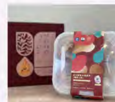
紅豆鮮奶水滴蛋捲 特價350 原價399

南國紅豆來自屏東萬丹，以在地紅豆為核心，專注紅豆加工與特色商品開發。透過獨特水洗日曬工法，提升紅豆香氣與品質，打造多元伴手禮與節慶禮盒。結合南國溫暖與現代美感，讓傳統紅豆成為兼具質感與日常感的台灣特色選物。