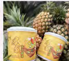
鳳梨苦瓜雞湯 特價450/5罐 原價110/罐