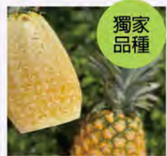
玉蘭花鳳梨(數量有限) 特價150/顆 原價180/顆

阿美鳳梨以一條龍六級產業化模式，從育苗、栽培到加工與銷售全面把關品質。結合智慧農業、食農教育與創新設計，提升台灣鳳梨的品牌價值與附加價值。秉持對土地與品質的堅持，致力打造台灣鳳梨的國際品牌標竿。