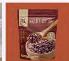
一碗紅豆湯 特價350/5包 原價99/包