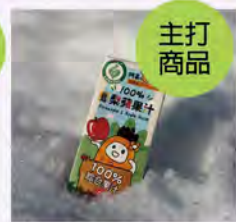
鳳梨蘋果汁 特價750/24入 原價840/24入