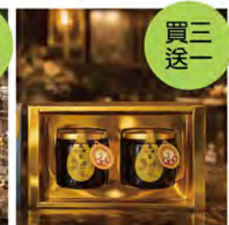
雙罐禮盒組 推薦價880