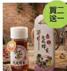
龍眼蜂蜜700克 推薦價1,280/罐