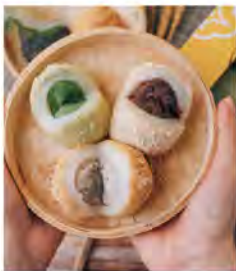
餡包麻糬(8個) 推薦價150

著名排隊伴手禮，使用在地濁水溪米、古法製作Q彈不黏牙麻糬。特色為「DIY沾麻糬」搭配特製花生粉，深受喜愛。