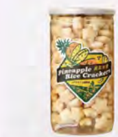
石埕島鳳梨米果 特價300/2罐 原價180/罐

承襲三代栽種經驗，以紅糖與黃豆酵素自然培育，不使用農藥與化學肥料，堅持手工除草，孕育出果肉細緻、甜度高且香氣濃郁的鳳梨風味。從土地當果實，凝聚職人用心與時間淬煉，讓每一口的展現嘉義大林最純粹的甘甜滋味。