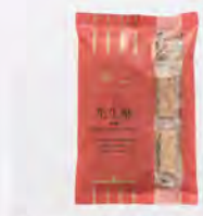
無二(花生酥)研磨 特價255 原價290