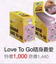
Love To Go 隨身最愛 特價1,000 原價1,440

強調「風味來自土地」，並透過水果、茶葉與特殊桶陳工藝，呈現台灣獨有的香氣層次與熟成風格。