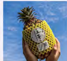
上等鳳梨 特價150 原價180