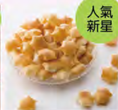
羊芋脆餅(海鹽) 推薦價85