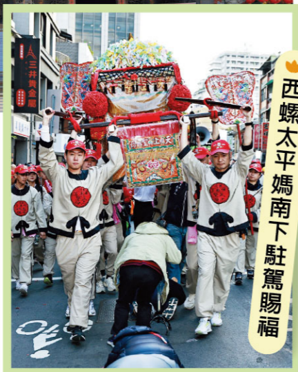
西螺太平媽南下駐駕賜福

宮廟介紹 西螺福興宮主祀天上聖母「太平媽」，立廟超過三百年，為濁水溪流域重要媽祖信仰中心。從農業開墾到街市繁盛，太平媽長年守護地方平安，也承載西螺人的信仰記憶與生命故事。 文化亮點 最具代表的「西螺太平媽祖文化祭」，為全台灣少見於秋季舉行的媽祖遶境活動。遶境隊伍行經濁水溪兩岸，串連聚落與地方生活，展現西螺獨有的宗教文化風景。 展覽內容 展區將展示供桌與神轎，透過傳統祭祀陳設與廟會元素，呈現太平媽信仰中的敬神文化、祈福意象與地方廟宇氛圍。