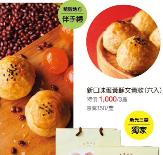
新口味蛋黃酥文青款 (六入) 特價 1,000/3盒 原價350/盒 新光三越 獨家 ■ 預購時間：6/1(一)~6/14(三) ■ 取貨時間：6/18(四)~6/19(五) 獲獎紀錄 2014德國世界酒類競賽 Mundus Vini金牌

新口味食品行 | 經典蛋黃酥層層酥香 新口味蛋黃酥以傳統工藝結合創新風味，外層酥皮層次分明、奶香濃郁，內餡選用細緻綿密沙，搭配鹹香飽滿蛋黃，口感鹹甜交織。今年特別推出創新口味，融入在地食材與獨特風味元素，帶來不同以往的驚喜體驗。無論作為節慶送禮或日常品嚐，都能感受經典與創新的完美結合，呈現令人回味無窮的幸福滋味。