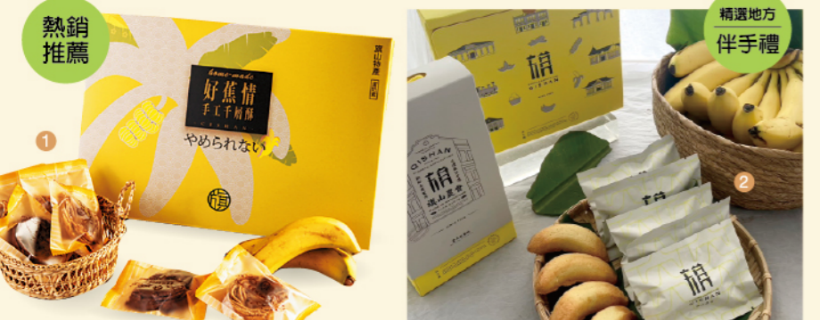
01. 好蕉情手工干層酥 特價 399/盒 原價460/盒 02. 金蕉旺來酥禮盒 (6入/10入) 推薦價 330/550 獲獎紀錄 榮獲觀光署統計的「全台灣吸客冠軍」 2024金蕉旺來酥榮獲金點設計獎

旗山農會 | 全台灣吸客冠軍 旗山農會以在地農產為核心，嚴選高雄旗山及周邊優質農戶的新鮮作物，推廣安心、友善土地的農產品。品牌致力於縮短產地到餐桌的距離，提供原味保留、品質穩定的農產加工品與特色選物，讓消費者能安心品味在地風土與農業職人精神，支持永續農業與地方發展。