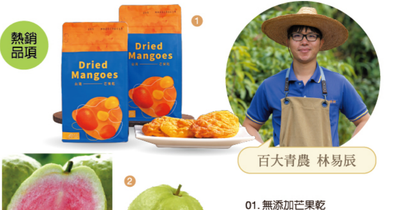
01. 無添加芒果乾 推薦價 260/包 02. 珍珠芭樂/彩虹芭樂 特價 100/3入 原價120/3入

辰品 | 打造高品質、無添加的台灣天然果品 致力於打造高品質、無添加的天然果品，精選台灣在地水果，以嚴謹製程保留原始風味與營養。主打芒果鮮果粉、芭樂鮮果、芒果乾、鳳梨乾、芭樂乾等產品，兼具美味與健康，讓消費者安心享用土地的真實滋味。