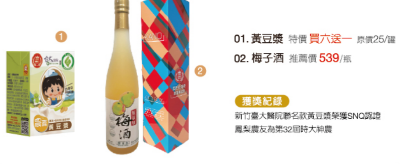
01. 黃豆漿 特價 買六送一 原價25/罐 02. 梅子酒 推薦價 539/瓶 獲獎紀錄 新竹台大醫院聯名款識產銷履歷農產黃豆漿獲SNO認證 鳳梨農友為第32屆時大神農

嘉農合作社 | 我們是站在巨人肩膀上努力爬 合作社成員產品多元，包含鳳梨、咖啡、大豆及乳牛...等，也有專家老師參與其中。他透過連結不同產品的組合，投入加工市場，台大醫院新竹台大分院聯名款識產銷履歷農產黃豆漿。