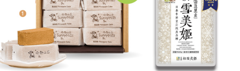
01. 微熱山丘鳳梨酥 (10入) 推薦價 670 02. 樂米穀場富里初雪美姬米 (1.5kg) 推薦價 259/包 03. 微醺蜜月桂花烏龍蜂蜜酒 (700ml) / 微醺蜜月蜂蜜酒龍蜜酒 (700ml) 推薦價 1,200/瓶