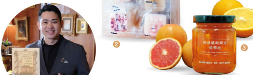
01. 桂花檸檬三寶柑果醬 推薦價 320/罐 02. 綜合花果糖磚 推薦價 200/盒 03. 柴焙龍眼琴酒葡萄柚果醬 推薦價 350/罐 獲獎紀錄 2025英國世界柑橘果醬大賽 雙金獎

果食男子 | 國際獲獎果獎品牌 專注於將台灣各地特色水果透過細膩的手工製作，封存成一罐罐果醬，並揉合地酒、香料、香草、蜂蜜等搭配，希望透過四季風土滋味，讓臺灣島嶼美好的果物走入每個人的餐桌生活裡。