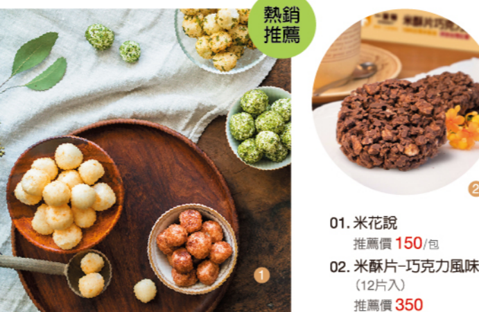
01. 米花說 推薦價 150/包 02. 米酥片-巧克力風味 (12片入) 推薦價 350

一米特 | 榮獲十大嚴選穀類產品獎 從台灣米食出發的點心品牌。以麻糬與米果為核心，將熟悉的米香，在保留傳統工藝的同時，透過創新轉化，變成日常也能輕鬆享用的各式點心。從日常零食到節慶禮盒，一米特讓米食不只停留在記憶中，而是以更輕鬆、多元的樣貌，陪伴每一個生活時刻。