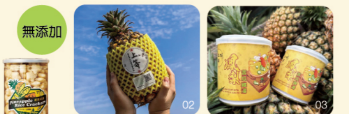
01. 石垣島鳳梨米果 特價300/2罐 原價180/罐 02. 上等鳳梨 特價150/顆 原價180/顆 03. 鳳梨苦瓜雞湯 特價450/5罐 原價110/罐

上等農場 | 三代傳承的鳳梨滋味 承襲三代栽種經驗，以紅糖與黃豆酵素自然培育，不使用農藥與化學肥料，堅持手工除草，孕育出果肉細緻、甜度高且香氣濃郁的鳳梨風味。從土地到果實，凝聚職人用心與時間淬鍊，讓每一口都展現嘉義大林最純粹的甘甜滋味。