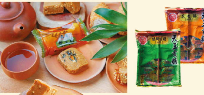
貢糖系列 特價 買六送一/買十送二 原價160/包 熱銷推薦

天王貢糖 | 金門貢夫傳統工藝 天王貢糖承襲金門在地傳統工藝，嚴選花生與麥芽糖製作，口感香酥不黏牙，展現經典金門伴手禮風味。品牌堅持手工製程與品質把關，打造濃郁花生香氣與層次口感，深受消費者喜愛，是具代表性的金門特色名產之一。