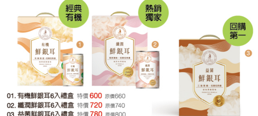
01. 有機鮮銀耳6入禮盒 特價 600 原價660 02. 纖潤鮮銀耳6入禮盒 特價 720 原價740 03. 益菌鮮銀耳6入禮盒 特價 780 原價800

光茵樂活 | 有機鮮銀耳領導品牌 斥資數千萬打造精準控溫、控濕、控氣流的「科技植物工廠」，並成功培育出高品質的有機銀耳(白木耳)。他不僅解決了農產受天氣影響的痛點，更將其發展成全台藥局與超市熱銷的銀耳飲品，年營業突破億元。