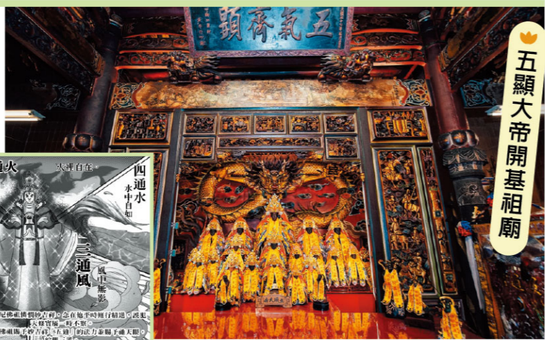
五顯大帝開基祖廟

宮廟介紹 埤腳五通宮主祀五顯大帝，為彰化大村、埔心、員林、溪湖一帶重要信仰中心，也是彰化縣歷史建築。五顯大帝信仰隨先民渡海來台，香火延續至今364年，承載地方聚落的平安祈願與信仰記憶。 文化亮點 五通宮保存傳統廟宇建築與五顯大帝信仰文化，五顯大帝各司其職，象徵護佑平安、功名、健康、財運與除厄解難，是台灣民間信仰中的特色之一。 展覽內容 以漫畫方式介紹五顯大帝信仰故事，透過圖像與文字呈現其文化內涵與神格特色，讓民眾更輕鬆認識地方信仰的歷史與魅力。