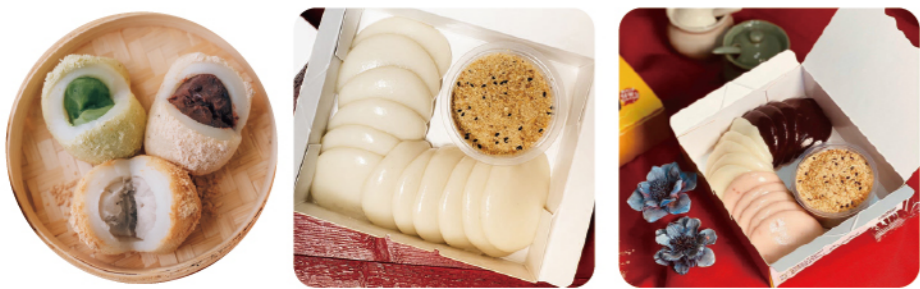
餡包麻糬 推薦價 150/8個 DIY沾麻糬 推薦價 150/盒 三色片沾麻糬 (6個/15個) 推薦價 100/200

Q彈麻香 | 古法手作的濁水溪滋味 人氣團購伴手禮 著名排隊伴手禮，主打使用在地濁水溪米、天然古法製作的Q彈不黏牙麻糬。特色為創始的「DIY沾麻糬」，搭配特製花生粉，深受喜愛。