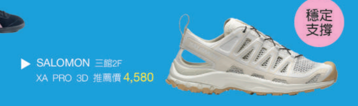
▶ SALOMON 三館2F XA PRO 3D 推薦價 4,580