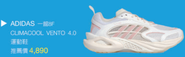
▶ ADIDAS 一館8F CLIMACOOL VENTO 4.0 運動鞋 推薦價 4,890