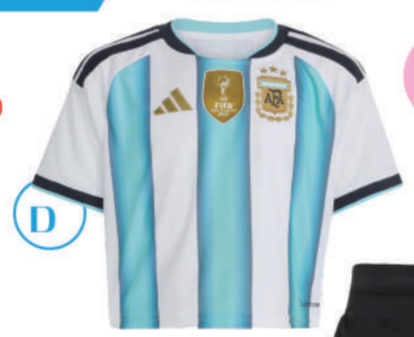
▲ 三館5F 短袖上衣 推薦價 2,690