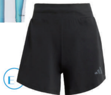
E.PACER 3D COOLING 運動短褲 推薦價 1,690