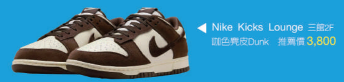
▲ Nike Kicks Lounge 三館2F 腳色麂皮Dunk 推薦價 3,800