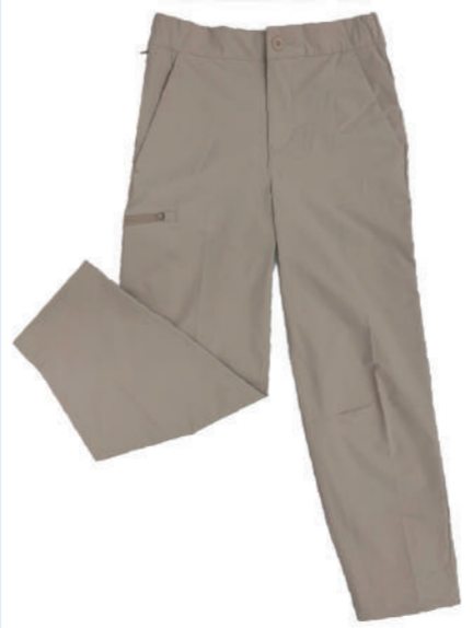
Columbia 一館8F 超防曬UPF50+防潑長褲 特價 5,200 原價 5,880