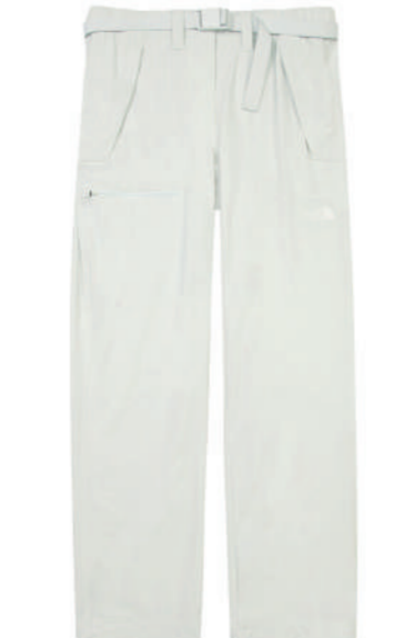
The North Face 一館8F 女款米色FLASH-DRY速乾戶外徒步長褲 推薦價 4,380