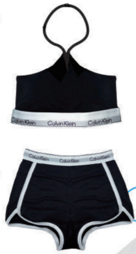
A. Calvin Klein Underwear 一館3F Icon Cotton Modal系列 推薦價 4,060/套