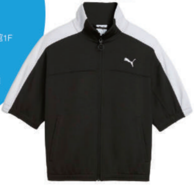
PUMA 一館8F 流行系列T7短袖立領外套 推薦價 2,280