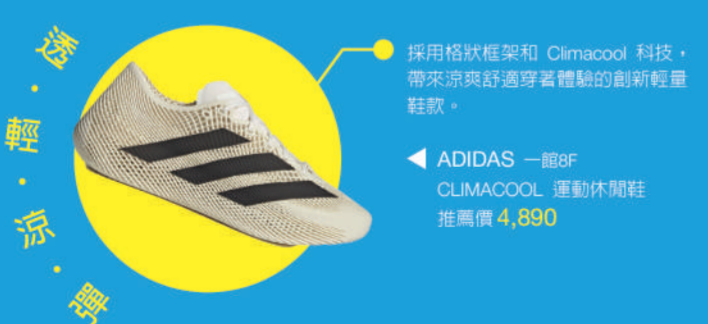
▲ ADIDAS 一館8F CLIMACOOL 運動休閒鞋 推薦價 4,890