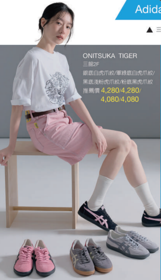
ONITSUKA TIGER 三館2F 銀底白虎爪紋/軍綠底白虎爪紋/ 黑底淺粉虎爪紋/粉底黑虎爪紋 推薦價 4,280/4,280/ 4,080/4,080