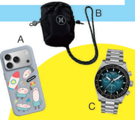
A. RHINOSHIELD 三館2F 麗人 Twodeerman聯名款 推薦價 1,380起