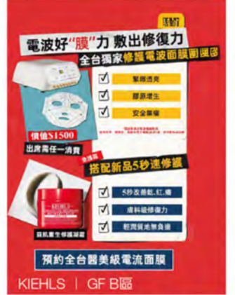
KIEHL'S | GF B區