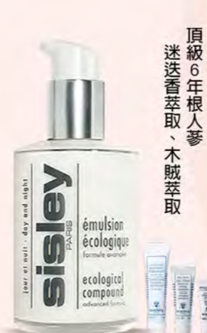
SISLEY GF B區 全能乳液組 購 全能乳液 125ml 贈 極致賦活水凝精華 2ml+極致防禦未來 精華4ml+身體淨采磨砂凝露 15ml 特價8,500 原價10,503