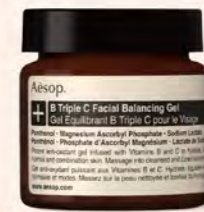
Aesop GF B區 Aesop 肌膚調理 凝露60ml 推薦價4,050