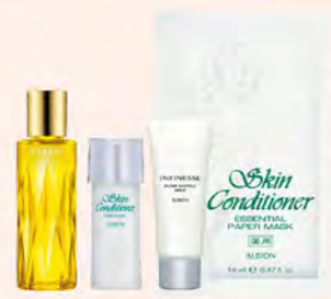
ALBION GF A區 黃金植萃全效精華油組 購 黃金植萃全效精華油40ml 贈 賦活緊緻彈力滲透乳 24g+ 健康化妝水 27ml+健康面膜 特價1,650 原價2,280