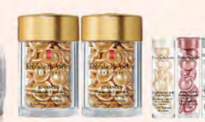
Elizabeth Arden GF A區 黃金修護膠點組 購 超進化黃金導管膠囊 30顆 (正貨)x2 贈 NEW HA白金滋潤保潔膠囊7顆+HPR玫瑰 金抗衰膠囊7顆+光纖鑽白智慧淨斑膠囊7顆 特價3,950 原價5,535