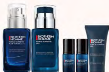
BIOETHERM GF B區 極量緊膚雙星組 購 男仕極量緊膚凝露50ml+ 極量緊膚凝露全效精華60ml 贈 男仕極量緊膚凝露20ml 極量高濃度維他命C精華5mlx2 特價9,850 原價12,720