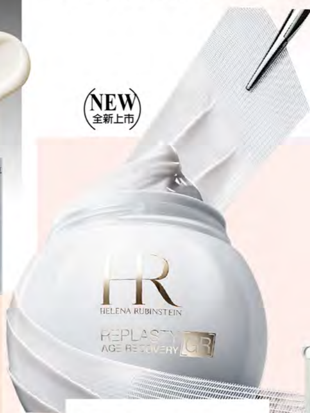
Helena Rubinstein GF B區 極彈白繃帶修護乳霜 50ml 推薦價13,300