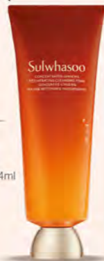
SULWHASOO GF B區 滋陰舒容軟潤霜 贈 極致臻秀潔顏霜 40g+潤澤養膚精華 4ml 特價1,880 原價2,712