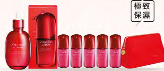
資生堂國際櫃 GF B區 購 紅妍山茶花修護精華50ml+山茶花精華油75ml 贈 紅妍山茶花修護精華10mlx5+紅妍化妝包 推薦價6,705