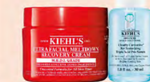
Kiehl's GF B區 購 益肌生修復凝霜 50ml+激光三酸煥膚精華液 30ml 贈 激光極淨白淡斑精華 4mlx2+ 集效清潤潔膚油/LA凝露SPF50 PA++++ 5ml 特價3,460 原價4,746