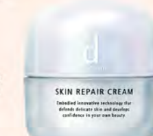
資生堂東京櫃 GF B區 d program 敏感話題 保潔修護霜 推薦價1,300