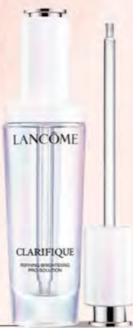
LANCÔME GF B區 超極光淨亮淡斑激萃50ml 推薦價5,650