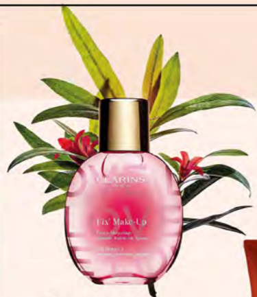
CLARINS GF B區 玫瑰精華定妝噴霧 推薦價1,350