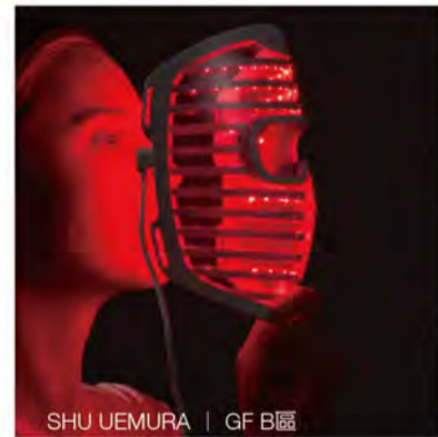
SHU UEMURA | GF B區