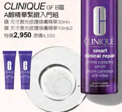
CLINIQUE GF B區 A醇精華緊緻入門組 購 天才愈光修護換膚精華30ml+ 贈 天才愈光修護換膚精華10mlx2 特價2,950 原價4,550

全面提升肌膚健康 與質感的保養計畫。 有效改善乾燥粗糙， 使膚質更細嫩平滑。 強化肌膚保水結構， 長效鎖水不流失。