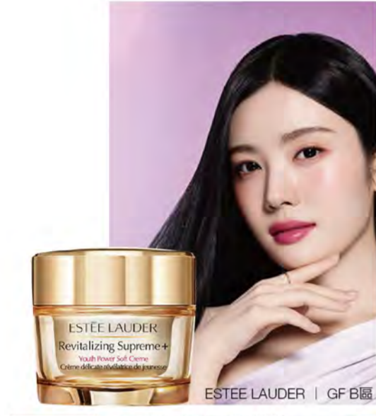
ESTÉE LAUDER | GF B區