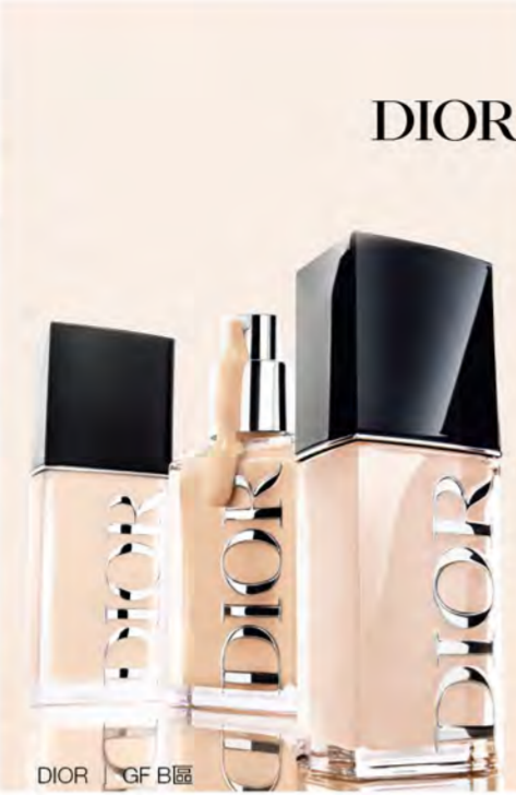
DIOR | GF B區