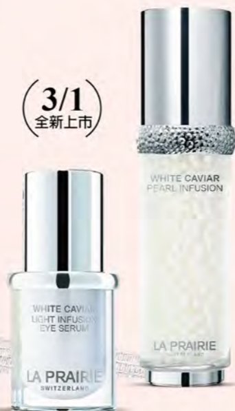
LA PRAIRIE GF A區 鑽白魚子系列 鑽白魚子眼部精華 推薦價14,900