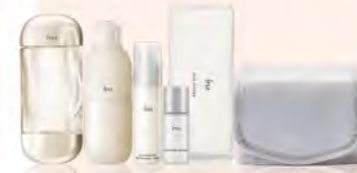
IPSA GF B區 全新 明星修護MAX上市組 購 全新 ME自淨循環液N (舒緩) 175ml/ ME自淨循環液N 175ml+全新 流金保潔 爽膚水 200ml(3/1上市) 贈 柔潤潔膚乳50ml+逆齡角質發光精華E 30ml+化妝棉50入一包+化妝棉收納盒乙個 特價4,050 原價5,275