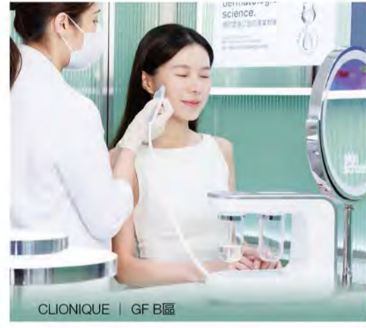
CLINIQUE | GF B區