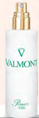
VALMONT GF A區 奕舒柔敏前導精露 150ml 推薦價4,800