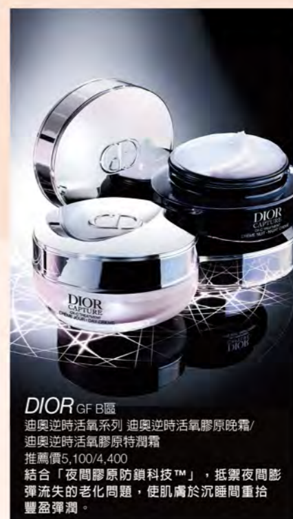
DIOR GF B區 迪奧逆時活氣系列 迪奧逆時活氣膠原晚霜/ 迪奧逆時活氣膠原特潤霜 推薦價5,100/4,400 結合「夜間膠原鎖鎖科技™」，抵禦夜間影 彈流失的老化問題，使肌膚於睡眠間重拾 豐盈彈潤。

完美修護肌膚防護層， 水分養分不流失。 肌膚健康強韌，增加 後續高效保養吸收。 喚醒肌膚原生光澤， 展現細緻肌膚。