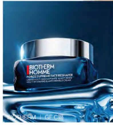
BIOTERM | GF C區