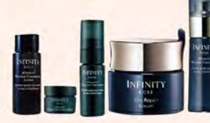
KOSE GF A區 逆時發光肌養成組 實 無限肌賦 逆時肌賦抗皺精華 40g 或 無限肌賦 3D微生肌活保潔精華 50ml 贈 無限肌賦 3D微生肌活保潔凝乳 10g+ 無限肌賦 3D微生肌活保潔凝乳 10g+ 無限肌賦 3D微生肌活保潔精華 14ml 推薦價2,780-3,400