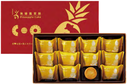
26-01-4602 吳寶春 無嫌鳳梨酥禮盒 售價 799 元 蛋奶素