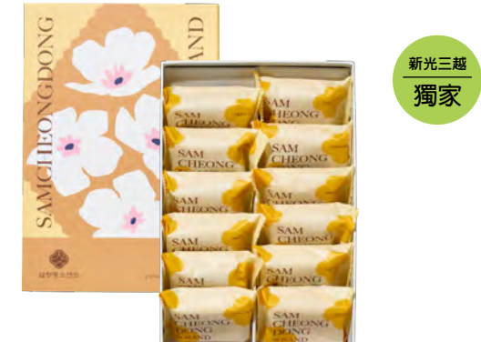
26-01-3403 三清洞 SOSAND 原味奶油三明治夾心餅 售價 980 元 初登場