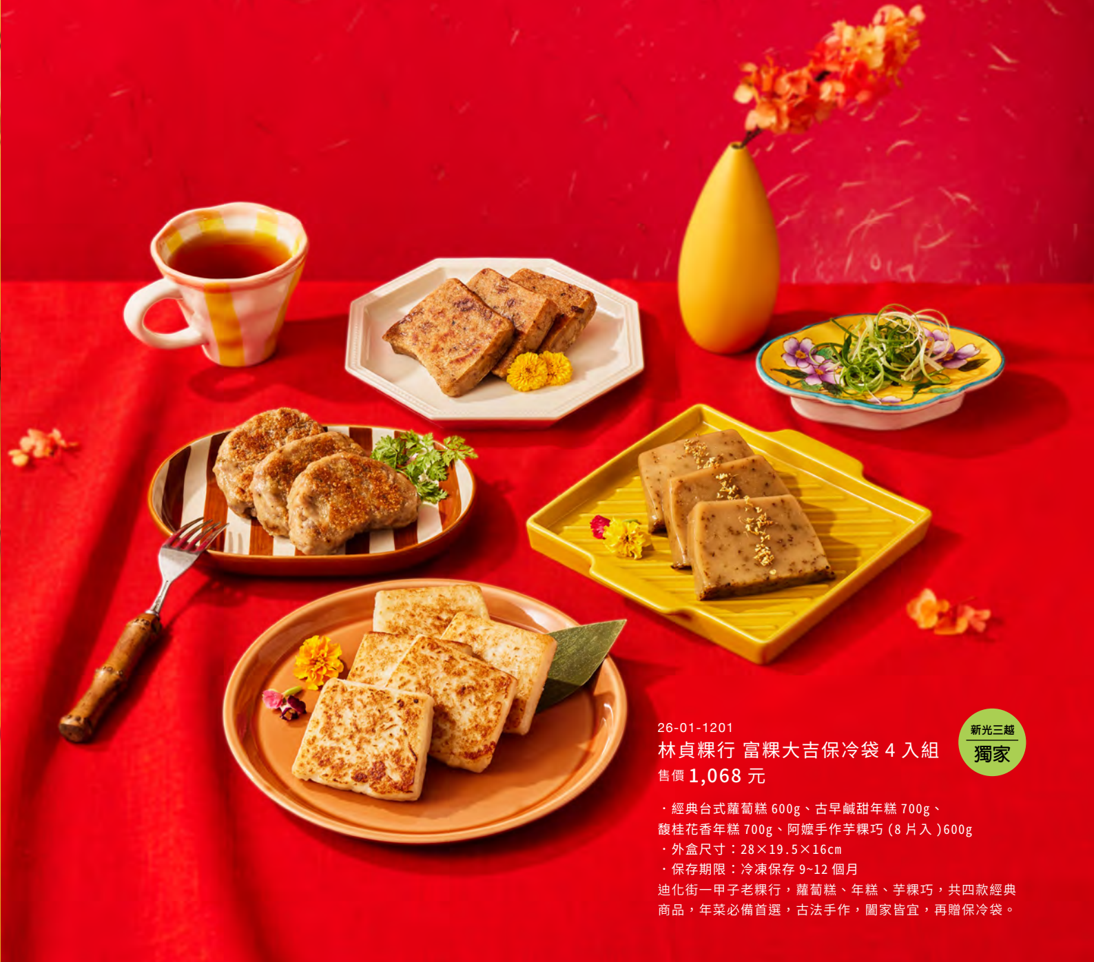
26-01-1201 林貞粿行 富粿大吉保冷袋 4 入組 售價 1,068 元

· 九尾草雞湯 1800g、油飯 380g×2 入、雞汁蒜頭蝦 380g、梅菜控肉 550g、雙喜烤麩 320g，總重 3810g · 外盒尺寸：37×37×43cm · 保存期限：冷凍保存 90 天 來自天母士東市場名店，手工製作、口味道地，招牌油飯及家常料理不容錯過。