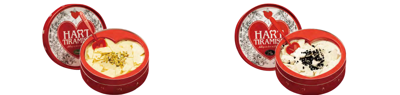
26-01-3302 HART TIRAMISU 敲敲提拉米蘇 開心果 特價 1,212 元 / 盒 原價 1,280 元 / 盒 初登場