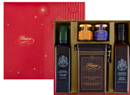
26-01-4903 Florian 經典佐味禮盒 售價 2,680 元 初登場

· MELISSA 木質龍眼蜜 420g、蜂蜜巧克力片 5g×10 入、 桂馥潤梨百合飲 7g×6 入 · 外袋尺寸：27.5×22.5×8cm · 保存期限：常溫保存 6 個月 Florian×MELISSA 龍眼蜜溫潤，蜂蜜巧克力香滑， 桂梨百合飲暖喉，一盒花蜜系午後。