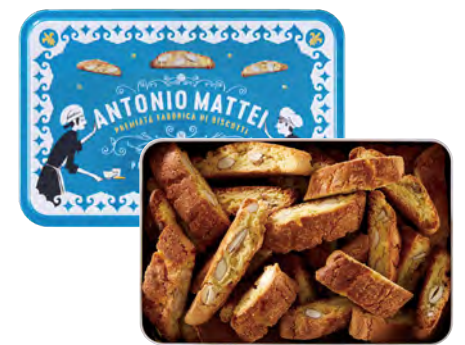
26-01-4003 MATTEI 雷納多禮盒 售價 1,100 元 初登場 (蛋素)