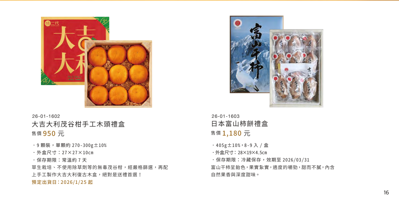
26-01-1602 大吉大利茂谷柑手工木頭禮盒 售價 950 元

・12 入裝，單顆 165g(±10%) ・外盒尺寸：35×26×8.5cm ・保存期限：到貨後冷藏 7 天 堅持「質」的豐收，忍痛打落七成果實化做春泥，創造出每一顆寶島南方棗超乎想像的自然甜度，比水梨還爽脆的口感，成就棗子界的精品。