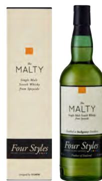
26-01-5404 蘇格蘭單一麥芽威士忌 Four Styles 麥芽香英尺高爾 2013 售價 1,380 元 初登場

· 容量：700ml×1 · 50ml×1 · 外盒尺寸：9.4×8.5×36cm · 酒精濃度：43% · 產地：英國 格蘭哥尼 12 年新年禮盒，高哥舉杯 · 與尼暢酩，高哥舉杯，敬彼此情誼綿長，一如哥尼 3 倍時長蒸餾及 6 年完熟備桶。