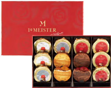
26-01-2405 1 st MEISTER 莓好焦糖雙享禮盒 12 入 售價 1,200 元 初登場 蛋奶素