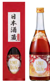
26-01-6402 請福樽桶儲藏梅酒 售價 1,580 元 初登場

· 容量：720ml×1· 提袋尺寸：8.5×8.4×27.6cm · 酒精濃度：8%· 產地：日本沖繩縣 沖繩香檬與日本柚子交織果香，酸中帶甜、清 爽順口。每一口都是酸甜的幸福感，各種料理 皆可搭配，讓過年團圓多一份清新好滋味。