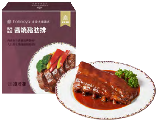
26-01-0703 北投老爺酒店 醬燒豬肋排 售價 799 元 初登場 · 600g( 固形物 400g)/ 盒 · 外盒尺寸：20×22×6cm · 保存期限：冷凍保存 365 天 嚴選自台灣的精緻豬肋排，搭配獨家特製的烤肉醬，融合多種香料的層次香氣，每一口都讓味蕾沉浸在滿滿的幸福感中。