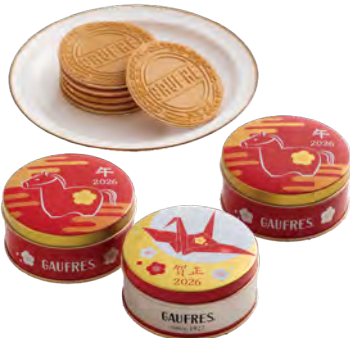
26-01-2401 神戶風月堂 新年限定 迷你法蘭酥組 18 入 售價 920 元 初登場