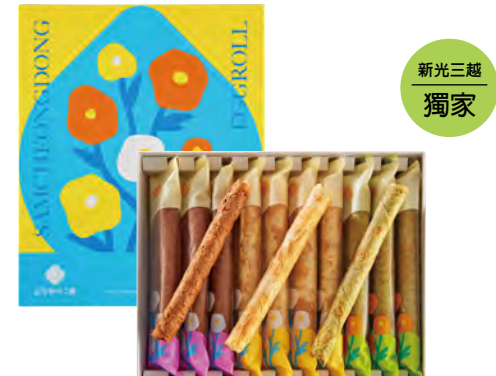
26-01-3402 三清洞 EGGROLL 綜合蛋捲禮盒 售價 980 元 初登場