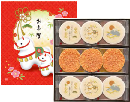
26-01-2402 桂新堂 馬年限定和風蝦煎餅祝賀禮盒 18 入 售價 1,160 元 初登場