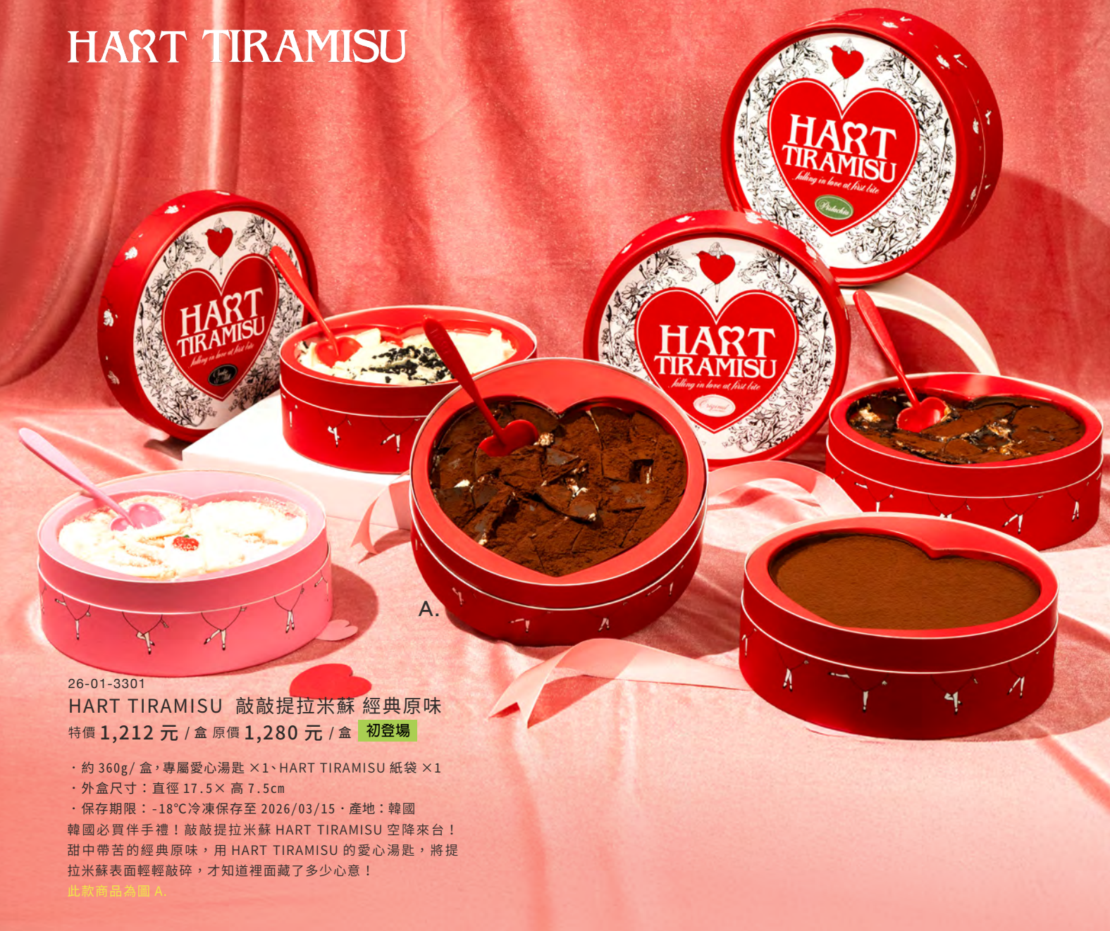
26-01-3301 HART TIRAMISU 敲敲提拉米蘇 經典原味 特價 1,212 元 / 盒 原價 1,280 元 / 盒 初登場