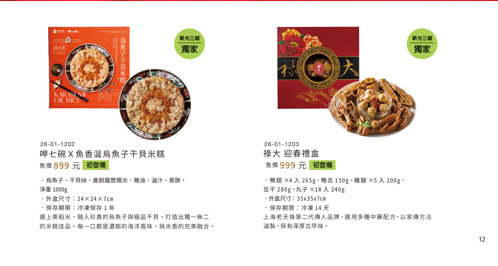
26-01-1202 呷七碗 X 魚香涎烏魚子干貝米糕 售價 899 元 初登場

· 金牌甘蔗雞 650g、滷味王松阪豬 85g、無骨醉雞腿 300g、 老饕半筋半肉 180g，總重 1215g · 外盒尺寸：24×12×18cm · 保存期限：冷凍保存 90 天 台東放山土雞，肉質鮮嫩、風味自然，每日現煮現賣，強調新鮮、健康與安心，是士東市場的人氣雞肉名攤。