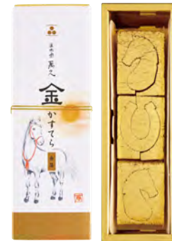
金澤萬久 金馬金箔蛋糕