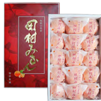
26-01-1403 日本和歌山 田村蜜柑禮盒 售價 1,480 元