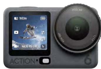
26-01-6903 DJI Osmo Action 6 暢拍套裝 售價 18,890 元

ROG XBOX Ally X 是由 ROG 與 Xbox 合作推出的高階手持電競裝置，採用 Windows11 作業系統，屬於「掌上電腦+遊戲機」的混合型平台。其定位為「可攜帶但效能強大」的遊戲裝置、適合遊戲玩家想在手持裝置上執行 PC/Steam/Xbox 遊戲的情境。