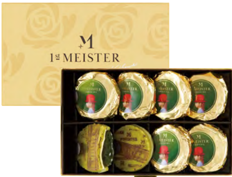
26-01-2406 1 st MEISTER 抹茶夾心餅乾 8 入 售價 840 元 初登場 蛋奶素