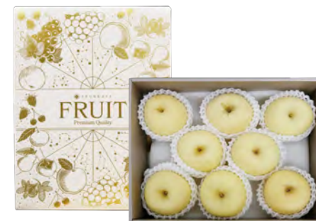
26-01-1402 日本青森 金星蘋果禮盒 售價 1,380 元