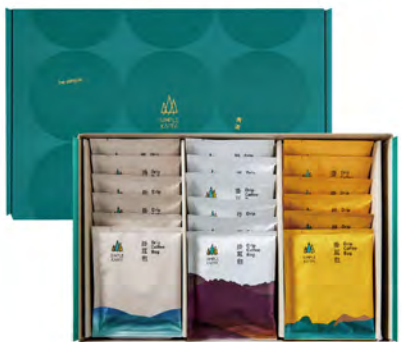
26-01-5102 興波世界冠軍濾掛式咖啡 18 入禮盒 售價 1,200 元