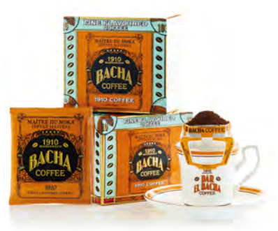
26-01-5001 1910 掛耳咖啡禮盒 售價 850 元

1910 MARRAKECH BACHA COFFEE 奄蕙咖啡於1910年成立於馬拉喀什， 專精100%阿拉比卡精品咖啡產品，僅採來自35個最負盛名咖啡生產國。 歡迎一同探索並盡情享受 奄蕙咖啡精緻禮籃，適合送禮、或升級您的居家咖啡體驗。