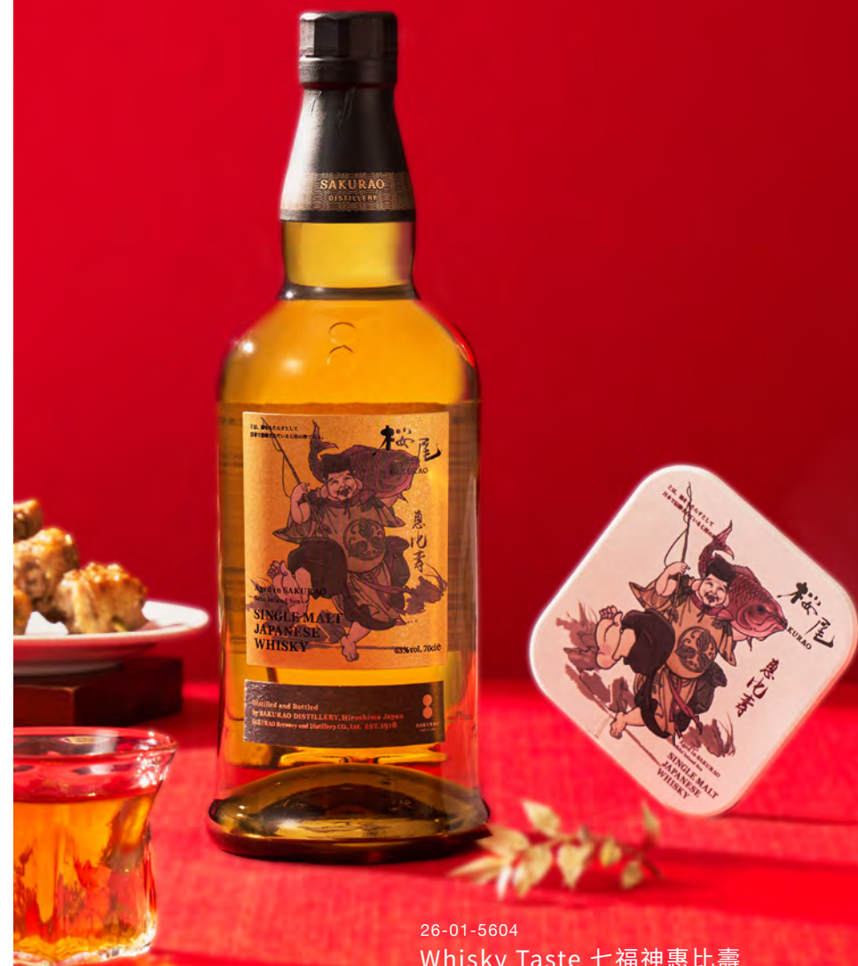
26-01-5604 Whisky Taste 七福神惠比壽 櫻尾單一麥芽威士忌 售價 2,580 元 初登場

惠比壽是七福神中最受商家歡迎的日本神祇， 代表的是商業繁盛和五穀豐收， 是認真於事業工作者的守護神！