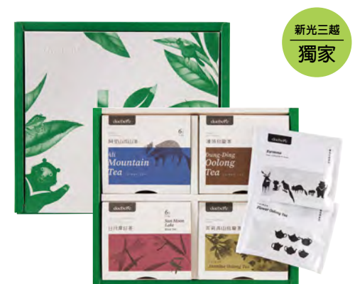
26-01-5206 daebeté 台灣茶四入禮盒 售價 990 元 初登場