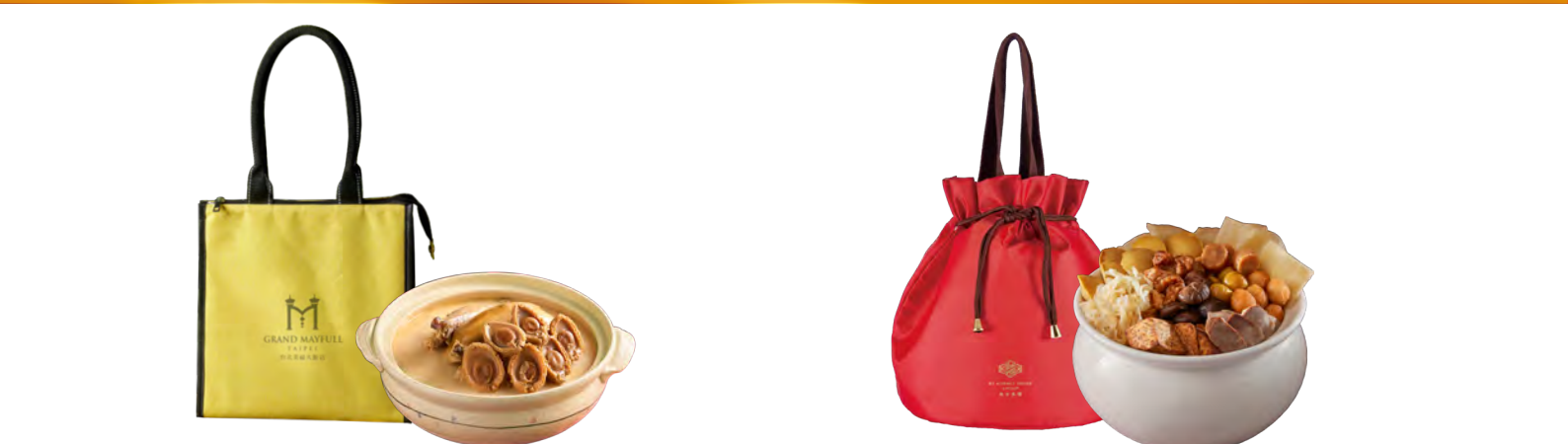
26-01-0502 台北美福大飯店 鮑魚黏嘴雞湯 售價 3,800 元

・麻油猴菇炊飯 600g、暖膳猴菇四寶盅 600g( 固形物 200g)、塔香杏鮑菇鳳眼果 300g、冬菇蜜汁烤麩 350g、蟹黃獅子頭 320g ・外盒尺寸：34×24×8cm ・保存期限：冷凍保存 365 天 陽明春天蟬聯五屆米其林綠星，也是台灣第一家榮獲米其林的蔬食餐廳。星級年菜精選食材與細膩手工料理，每一道菜都充滿家的味道，陪您度過最幸福的年節團聚時刻。