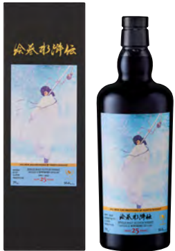
26-01-5806 繪卷水滸傳 豹子頭林冲 售價 25,800 元 初登場 · 容量：700ml×1 · 外盒尺寸：8.5×8.5×25.8cm · 酒精濃度：56.6% · 產地：蘇格蘭 選用雪莉桶，波摩酒廠以水滸傳『林冲』為主軸，深邃酒體、黑巧克力、黑櫻桃與淡雅泥煤堆疊，呼應水滸豪情，值得品味！

· 容量：500ml×1 · 外盒尺寸：8.5×8.5×18cm · 酒精濃度：55.6% · 產地：日本滋賀縣 選用波本桶，長濱蒸餾所酒廠周圍棲息的小鵜鵜夫人作為代言，細緻桂花蜜與冰糖銀耳，點綴煙燻麥芽香甜，大和撫子的端雅柔情，令人心醉神迷。