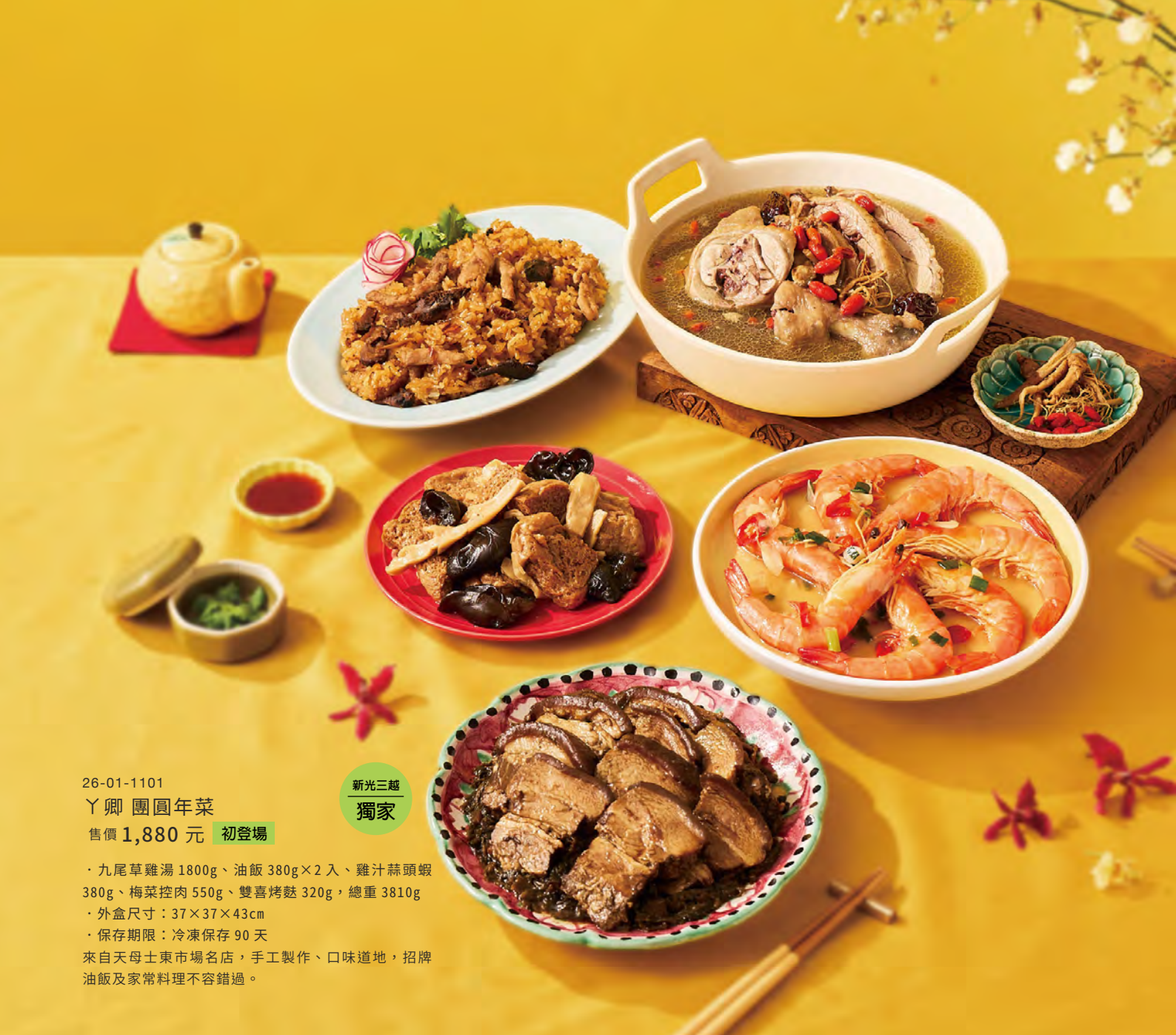
26-01-1101 丫卿 團圓年菜 售價 1,880 元 初登場