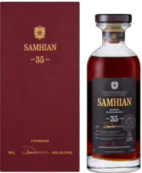
26-01-5702 蘇格蘭麥靈堡 35 年 OLOROSO 雪莉桶調和 威士忌錦盒 售價 8,000 元 初登場

· 容量：700ml×1、50ml×3 · 外盒尺寸：27.5×9×32cm · 酒精濃度：45%~46% · 產地：美國 原味桶展現優雅紮實酒體，交織奶油香草與烘烤香料；黑皮若紅酒桶帶出巧克力與鮮果辛香；黑啤酒桶則帶來烤穀物與核果香氣綿延。