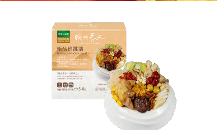
26-01-0602 陽明春天 極品佛跳牆 售價 2,188 元 初登場 全素

・鮑魚、花膠筒、干貝、芋頭、排骨酥、香菇、栗子、鳥蛋、魚皮、豬肚，淨重 2000g( 內含固形物 800g) ・保冷袋尺寸：紅色中型束口袋，直徑 24.5×33cm ・保存期限：-18 度 C 以下冷凍保存至 2026/03/12 嚴選鮑魚、花膠筒、干貝等珍饈入甕，搭配排骨酥、芋頭、栗子、鳥蛋、香菇與豬肚，慢火燉煮，湯底濃郁鮮美。