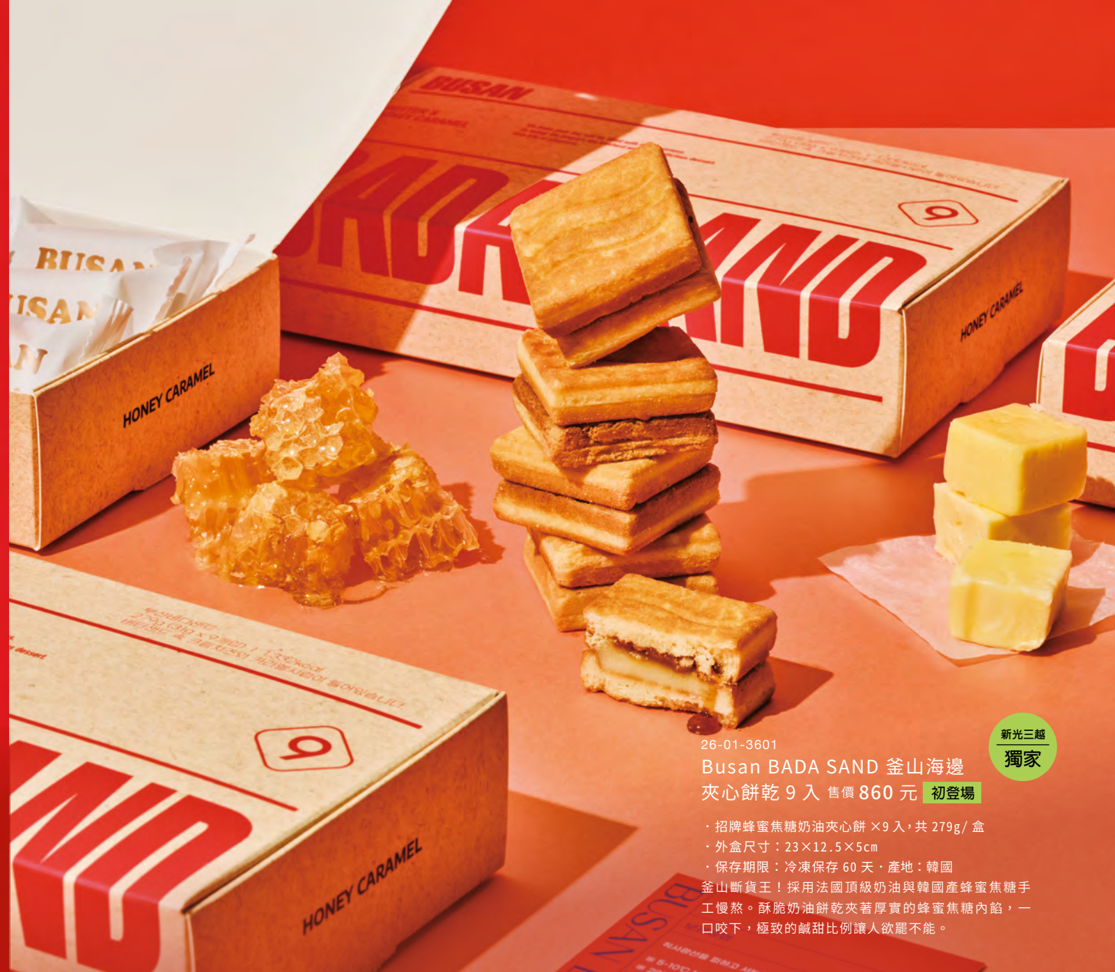
26-01-3601 Busan BADA SAND 釜山海邊 夾心餅乾 9 入 售價 860 元 初登場