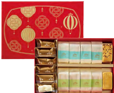
26-01-4303 Patisserie Francis 旋轉木馬點心坊 紅心奉糖禮盒 售價 1,200 元 初登場 (蛋奶素)

・原味蜂巢蛋捲 3 根×1 入、椰汁蜂巢蛋捲 3 根×1 入、原味蝴蝶酥 4 片×3 入、伯爵茶蝴蝶酥 4 片×2 入、黃金脆條 4 根×1 入，共 176g/ 盒・外盒尺寸：33×24×5cm ・保存期限：常溫保存 300 天 以「幸福呈現」為主題新年禮盒，紅金銀三色打造節慶感十足視覺設計。禮盒融合摩天輪、花卉與城市天際線，象徵幸福綻放、事業飛揚，傳遞最誠摯的新春祝福。