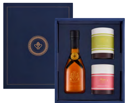
26-01-4902 Florian × MELISSA 桂梨花蜜禮盒 售價 1,720 元 初登場 (全素)

· MELISSA 木質龍眼蜜 420g、蜂蜜巧克力片 5g×10 入、 桂馥潤梨百合飲 7g×6 入 · 外袋尺寸：27.5×22.5×8cm · 保存期限：常溫保存 6 個月 Florian×MELISSA 龍眼蜜溫潤，蜂蜜巧克力香滑， 桂梨百合飲暖喉，一盒花蜜系午後。