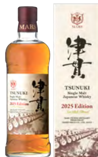
26-01-5503 津貫 2025 年度限定單一麥芽威士忌 售價 3,200 元 初登場