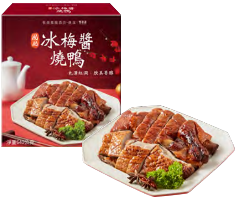
26-01-0702 長榮鳳凰酒店·礁溪 鳳凰冰梅醬燒鴨 售價 899 元 初登場 · 640g( 固形物 500g)/ 盒 · 外盒尺寸：20×22×6cm · 保存期限：冷凍保存 365 天 嚴選台灣土番鴨，經秘製香料烤至外皮酥脆、肉質鮮嫩多汁，再佐以宜蘭香氣濃郁的金桔冰梅醬，酸甜爽口，齒頰留香。