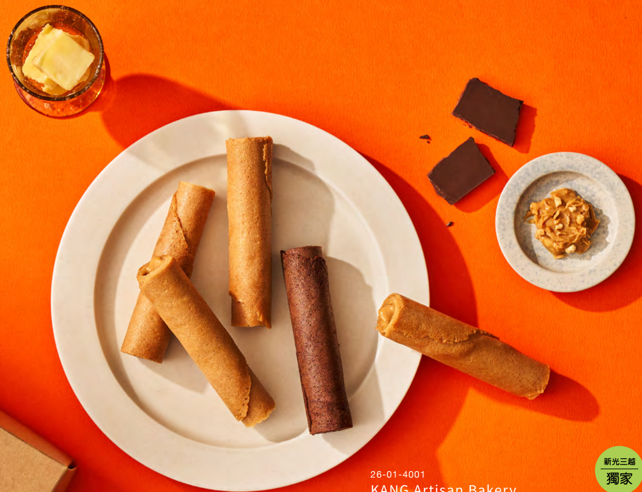
26-01-4001 KANG Artisan Bakery 手工蛋捲禮盒 售價 680 元 初登場 (蛋奶素)