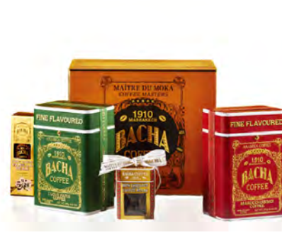
26-01-5003 皇家臻選咖啡禮籃 售價 4,330 元

· 咖啡 12g×25 袋 / 盒 · 外盒尺寸：26×13×11cm · 保存期限：常溫保存 36 個月 這款探索經典掛耳咖啡袋禮盒包含下列人氣甄選咖 啡品項： 三袋 1910 咖啡，三袋墨西哥蜜語咖啡，三袋馬拉 喀什清晨咖啡，兩袋托爾特卡巧克力咖啡，兩袋巴 黎之戀咖啡，兩袋塞維亞柑橘咖啡。三袋季風之秘 咖啡，三袋馬德雷山脈咖啡，兩袋納蘭諾山脈咖啡， 兩袋馬格達萊納脫因咖啡。