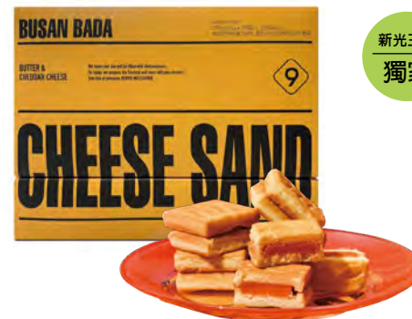
26-01-3602 Busan BADA SAND 慶洲黃起司 夾心餅乾 9 入 售價 860 元 初登場