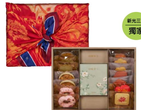
26-01-4203 羽曦堂 璟黛 風呂敷禮盒 售價 1,290 元 初登場 (蛋奶素)