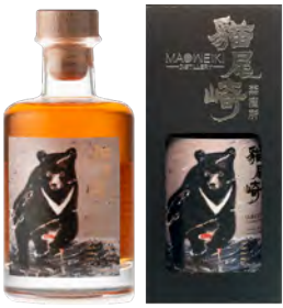
26-01-5802 貓尾崎台灣原生動物 台灣黑熊 單桶原酒 售價 1,180 元 初登場

· 容量：700ml×1 · 外盒尺寸：8×8×30.5cm · 酒精濃度：53.9% · 產地：蘇格蘭 Oloroso 雪莉桶，魁列奇酒廠釀製出，熟透果香與蜜香縈繞，巧克力與飽滿強壯的酒體，薪火餘韻帶來了「馬」年的好運！