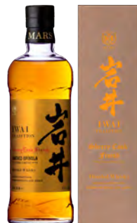
26-01-5504 岩井 PX 雪莉桶威士忌 2025 全新 酒標版本 售價 1,600 元 初登場