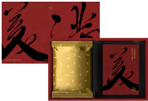
26-01-3902 TASTE by MMHG 富貴美滿禮盒 (美滿款) 售價 880 元 初登場 (蛋奶素)