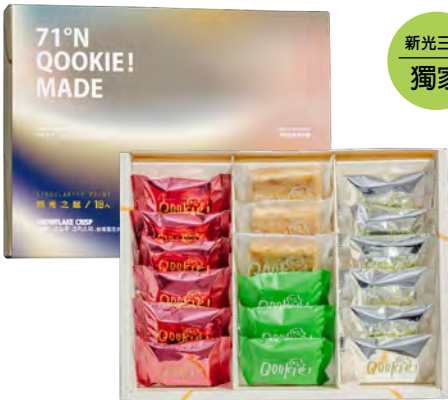
26-01-4605 Qookie! 初光之起經典甜鹹 18 入 雪 Q 餅禮盒 售價 730 元