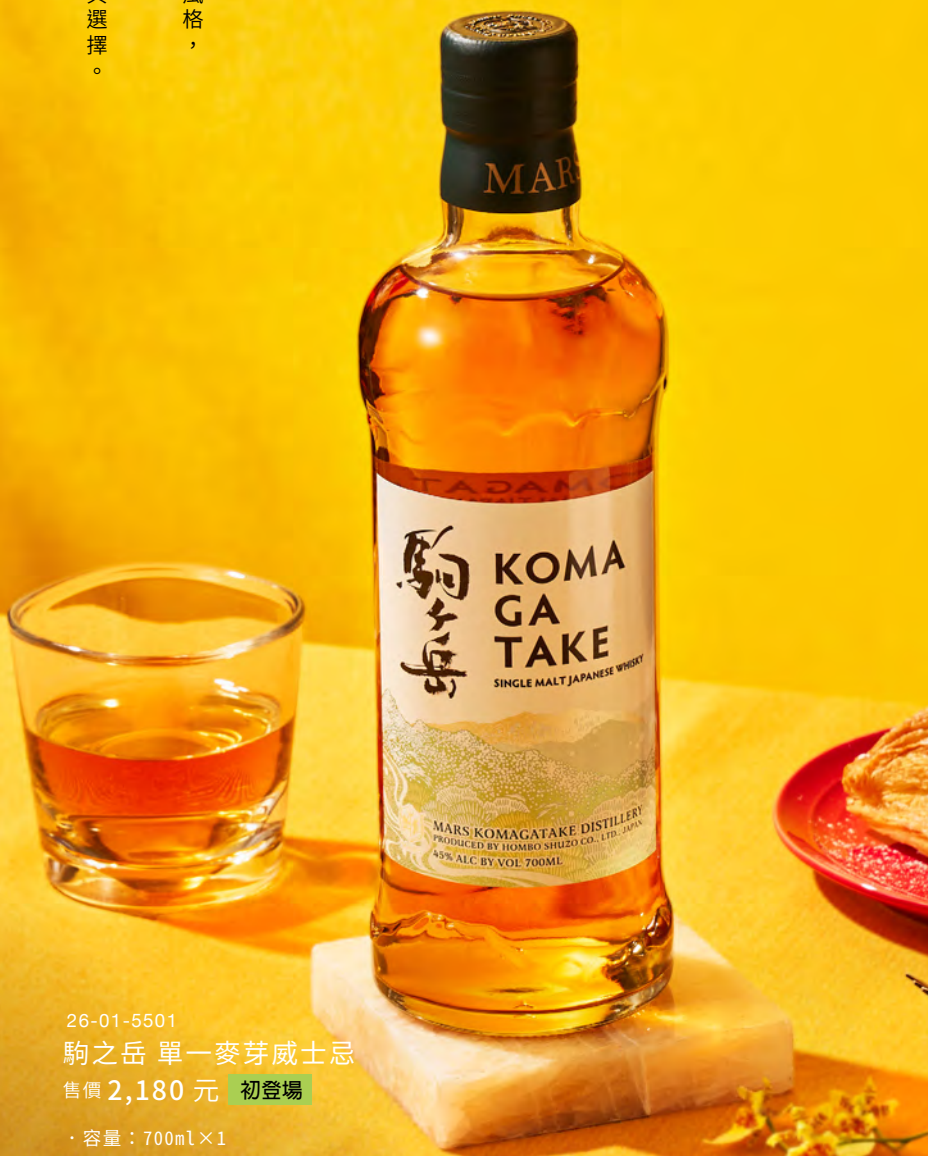
26-01-5501 駒之岳 單一麥芽威士忌 售價 2,180 元 初登場

完美展現駒之岳蒸溜所引以為傲的「清爽而溫潤」風格， 同時結合歷年累積的桶型管理與勾兌技術， 為威士忌愛好者帶來一種純淨且值得細細品味的經典選擇。