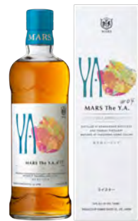
26-01-5502 The Y.A.#04 屋久島熟成 限定威士忌 售價 3,380 元 初登場