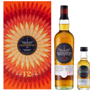
26-01-5402 格蘭哥尼 12 年新年禮盒 售價 1,280 元

· 容量：700ml×1 · 外盒尺寸：8×8×30.8cm · 酒精濃度：40% · 產地：蘇格蘭 熱帶果香與青蘋果、檸檬糖香氣交織，輕盈的酒體無論是除夕與親友小酌或送禮都相宜。