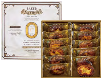
26-01-2304 C3 烤提拉米蘇 12 入禮盒 售價 1,050 元 初登場 蛋奶素