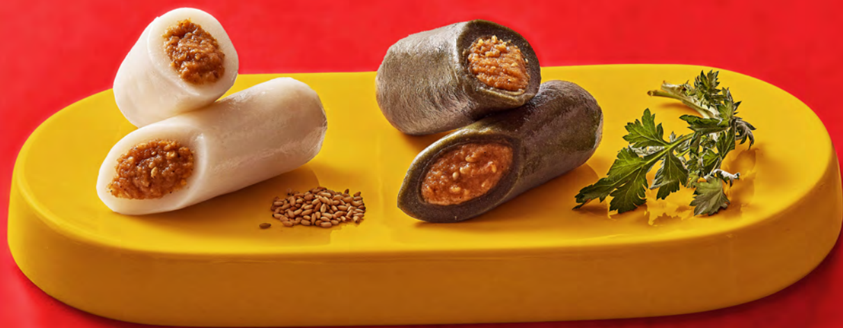
26-01-3501 母父堂 綜合芝麻蜜年糕 售價 680 元 初登場