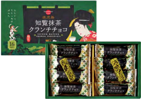
26-01-2302 山福製菓 知覽抹茶巧克力米果脆棒禮盒 售價 680 元 初登場