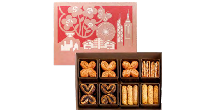
26-01-4302 皇玥 新年金裝精選禮盒 售價 1,098 元 (蛋奶素)

・花生糰 13g× 全素 5 入、杏仁糰 11g× 全素 5 入、芝麻糰 11g× 全素 5 入、莓果糰 13g× 全素 5 入、棗泥核桃糕 10g× 全素 8 入、杏仁酥 6g× 奶素 8 入、腰果酥 6g× 奶素 8 入、醬燒小米香 4.2g× 全素 8 入 ・外盒尺寸：40.5×27.3×8.2cm ・保存期限：常溫保存 25 天 共享漢餅不僅是美味的享受，更是心靈的慰藉，體現了濃濃的親情和溫馨的節日氣氛。漢餅文化承載著歷史，使我們珍惜當下，傳遞對新年的美好期望與祝福。