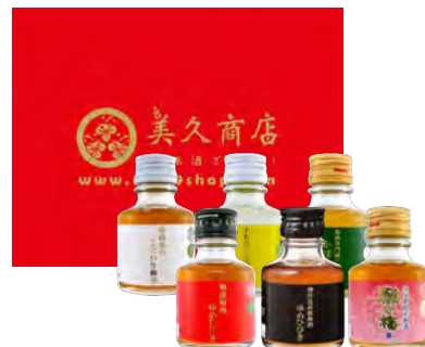
26-01-6403 美久商店 90ml 迷你梅酒 6 入禮盒 售價 2,000 元 初登場

· 容量：720ml×1· 提袋尺寸：8.8×8.8×28.2cm · 酒精濃度：15%· 產地：日本沖繩縣 以石垣島產蘭姆酒作為基底釀出梅酒，帶來前所 未有的口感。嚴選梅子浸漬，融合蘭姆的香氣、 焦糖與木質調味，酸甜清爽卻又醇厚圓潤。