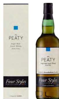
26-01-5403 蘇格蘭單一麥芽威士忌 Four Styles 泥煤香布納哈本 2014 售價 1,380 元

· 容量：700ml×1 · 威士忌×2 · 外盒尺寸：22.5×10×31cm · 酒精濃度：40% · 產地：英國 天空之島 21 年融合雪莉與橡木桶陳釀，帶出濃郁果乾、蜂蜜、太妃糖與淡雅煙燻風味，口感醇厚平衡，展現歲月優雅層次。