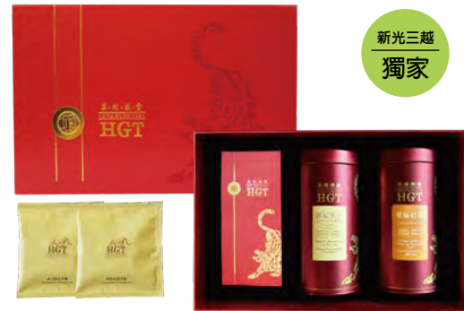
26-01-5201 HGT 華剛傳誦精品茶禮 售價 1,200 元 初登場