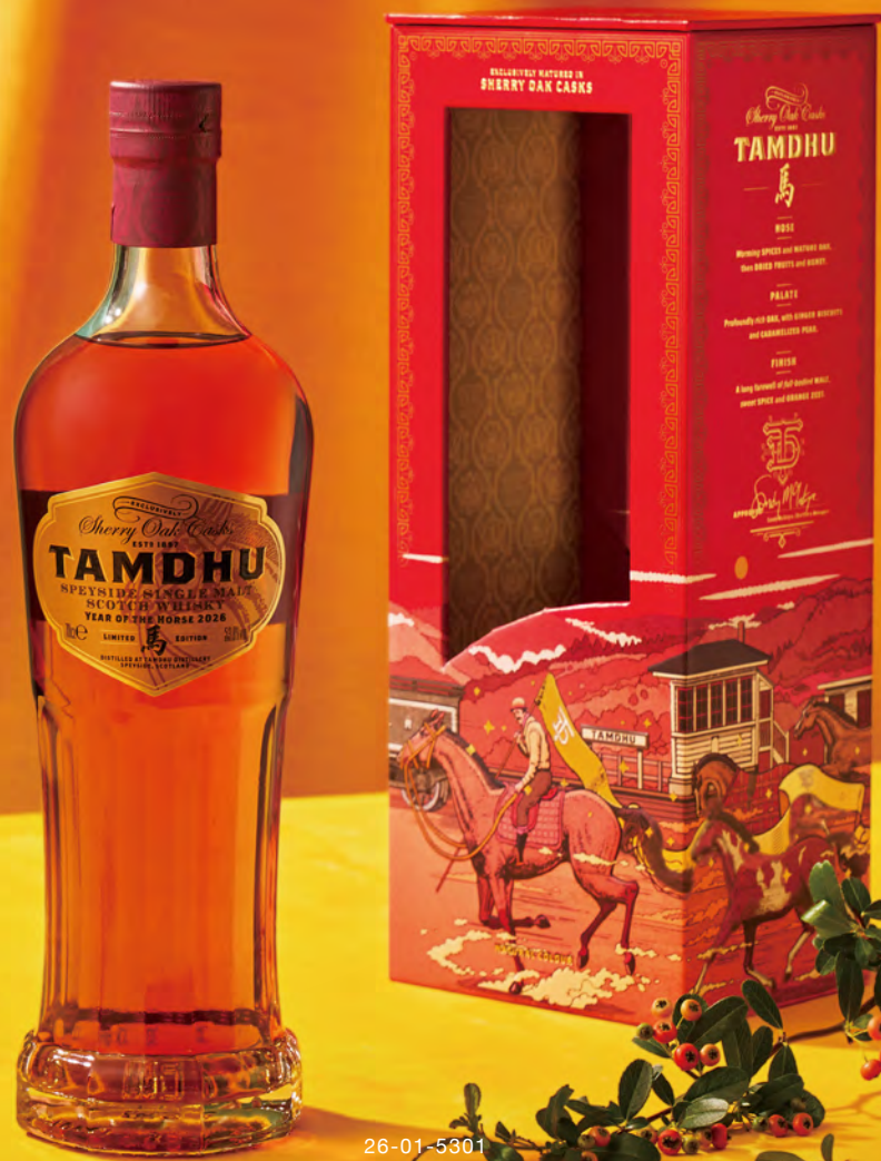
26-01-5301 坦杜 馬年生肖版 單一麥芽蘇格蘭威士忌 售價 2,680 元 初登場