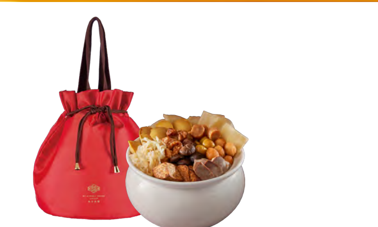
26-01-0503 請客樓 御品佛跳牆 售價 8,800 元 初登場

・淨重 2800±42g，固形量 1100±16.5g ・保冷袋尺寸：15×34×34cm ・保存期限：冷凍保存 90 天 由資深香港主廚坐鎮的〈潮粵坊〉經典鍋品，嚴選老母雞、雞骨、雞腳慢火燉煮 8 小時的精華原湯，再加入土雞、豬腳、鮑魚煨煮 2 小時，湯頭鮮甜，富含濃郁膠質，美味再升級。