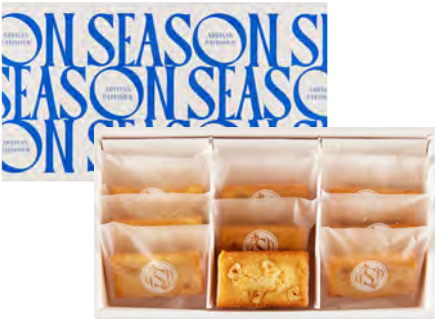
26-01-4603 SEASON 白松露榛果費南雪禮盒 售價 810 元 蛋奶素