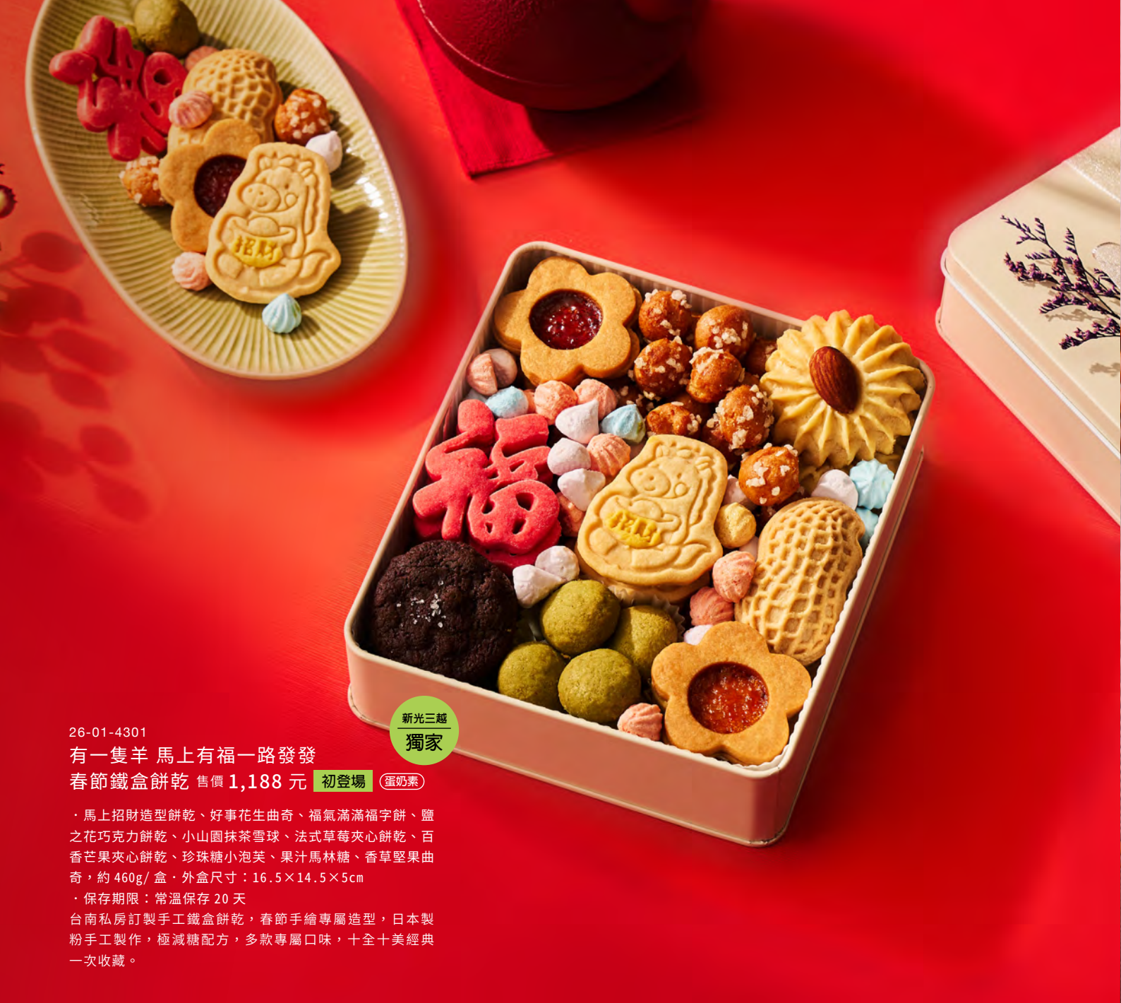
26-01-4301 有一隻羊 馬上有福一路發發 春節鐵盒餅乾 售價 1,188 元 初登場 (蛋奶素)

・馬上招財造型餅乾、好事花生曲奇、福氣滿滿福字餅、鹽之花巧克力餅乾、小山園抹茶雪球、法式草莓夾心餅乾、百香芒果夾心餅乾、珍珠糖小泡芙、果汁馬林糖、香草堅果曲奇，約 460g/ 盒・外盒尺寸：16.5×14.5×5cm ・保存期限：常溫保存 20 天 台南私房訂製手工鐵盒餅乾，春節手繪專屬造型，日本製粉手工製作，極減糖配方，多款專屬口味，十全十美經典一次收藏。