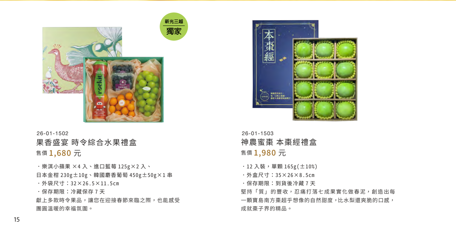
26-01-1502 果香盛宴 時令綜合水果禮盒 售價 1,680 元

・1 入，約 1300g±10%/ 盒 ・外盒尺寸：15.5×15.5×18cm・保存期限：冷藏保存 7 天 一株一果：在栽培過程中，從一株上雌花授粉後培育至小果階段，然後僅保留一個果實，其他小果摘除，以讓該株將所有養分集中於這顆果實上。溫室精控栽培、果形圓潤、香氣濃郁帶有麝香，口感柔滑、果汁豐富。