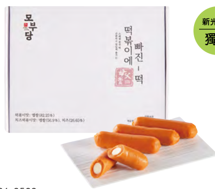
26-01-3503 母父堂 辣味起司蜜年糕 售價 780 元 初登場