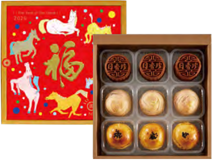
26-01-4604 北港日香珍 馬上有福春節禮盒 售價 750 元 蛋奶素