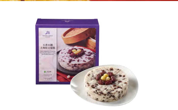
26-01-0603 天香樓 mini 天香小饅 上海紅豆鬆糕 售價 799 元 初登場

・1650g±1.5% (固形物 650g)/ 盒 ・外盒尺寸：23×11.5×18cm ・保存期限：冷凍保存 365 天 極品佛跳牆內含巴西蘑菇、鳳眼果、花菇等珍稀食材，搭配多種蔬菜文火慢燉。湯頭鮮甜美味，口感軟嫩豐沛，真材實料，為饕客唇齒留香。