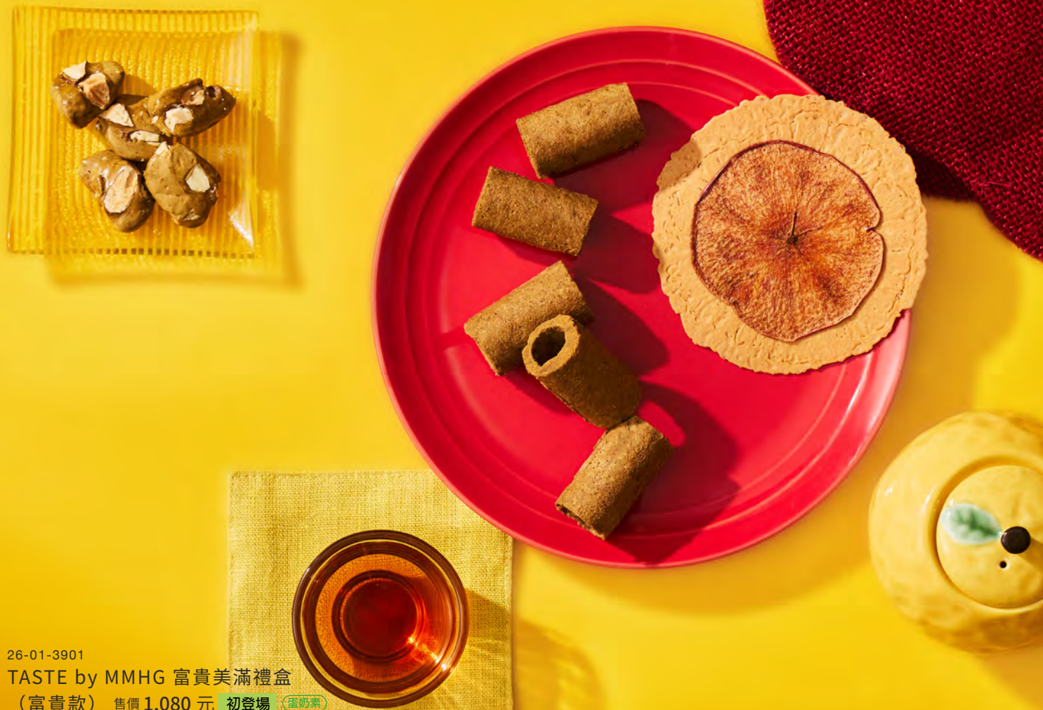
26-01-3901 TASTE by MMHG 富貴美滿禮盒 (富貴款) 售價 1,080 元 初登場 (蛋奶素)