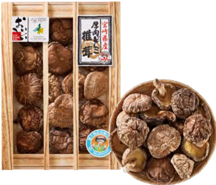
26-01-2306 宮崎縣產椴木厚肉冬菇禮盒 售價 1,200 元 初登場