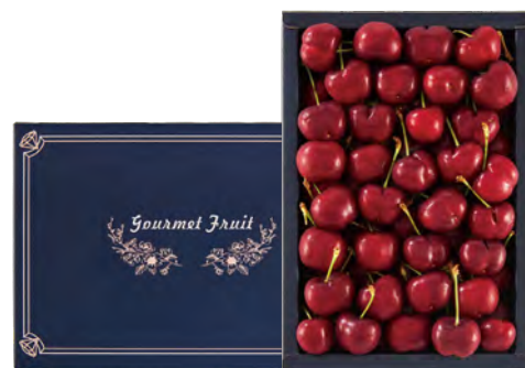
26-01-1406 澳洲塔斯馬尼亞櫻桃禮盒 售價 1,950 元