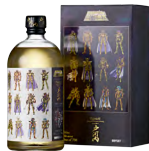
26-01-5603 Whisky Taste 聖域十二宮黃金聖鬥士 人像版 限定威士忌 售價 1,780 元 初登場