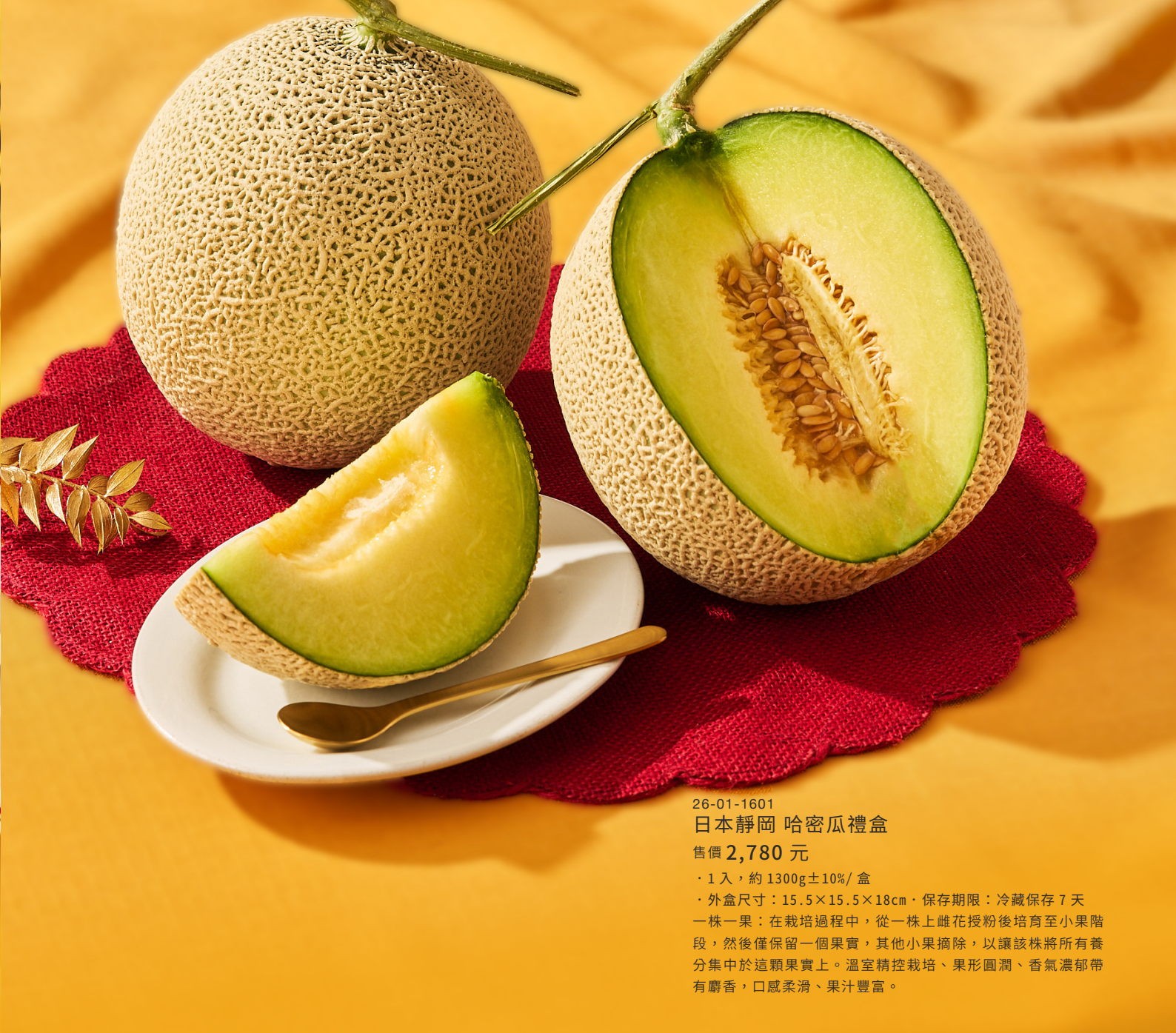
26-01-1601 日本靜岡 哈密瓜禮盒 售價 2,780 元

・大嘴巴櫻桃 28-32mm，共 2000g±10%/ 盒 ・外盒尺寸：28.5×15×12cm ・保存期限：冷藏 2-3 天 大嘴巴櫻桃，紐西蘭第一品牌，紅潤飽滿、果肉脆甜多汁。每一顆都精選自頂級果園，晶亮誘人，入口香甜爽脆，是饕客們冬季必嚐的頂級鮮果，盡享南半球甜美滋味！