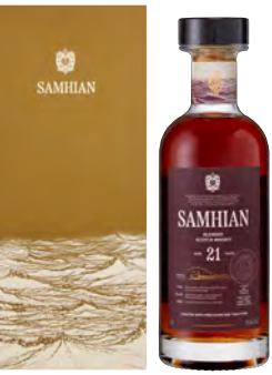
26-01-5703 蘇格蘭麥靈堡 SAMHIAN 21 年調和 威士忌金色禮盒 售價 2,388 元 初登場

· 容量：700ml×1 · 外盒尺寸：14×11×30cm · 酒精濃度：43% · 產地：蘇格蘭 豐富的熱帶水果加上甘甜醇厚的龍井茶，香甜的糖漿及多層次的橡木香料滋味，宛如一場味覺上的繽紛嘉年華。