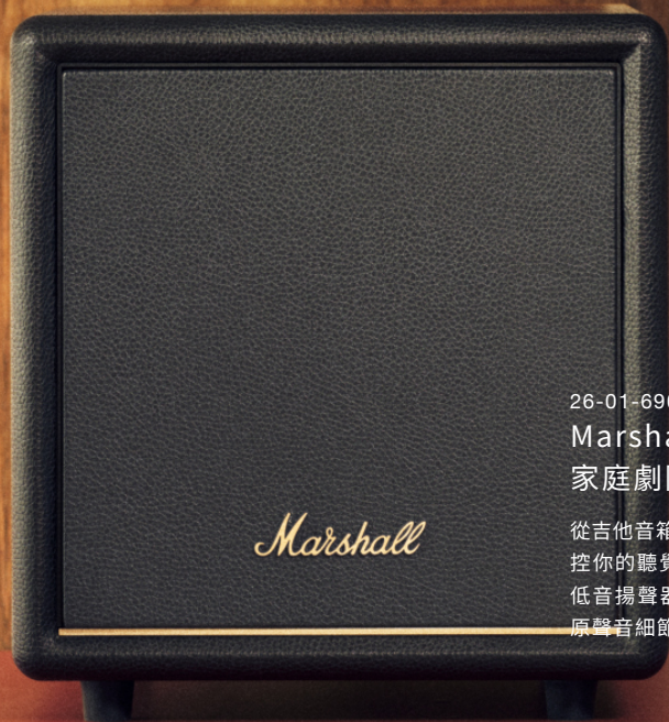
26-01-6901 Marshall Heston 120 家庭劇院聲霸 售價 36,990 元 初登場

從吉他音箱到音響再到聲霸，Marshall 已經準備好全面掌控你的聽覺饗宴。透過杜比全景聲技術，以及內建的兩個低音揚聲器，讓低音深沉渾厚、高音清澈透亮，全方位還原聲音細節，打造如劇院般的沈浸式立體音效體驗。