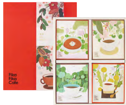
26-01-5103 Fika Fika Cafe 金蹄映春精品咖啡掛耳禮盒 售價 990 元 初登場