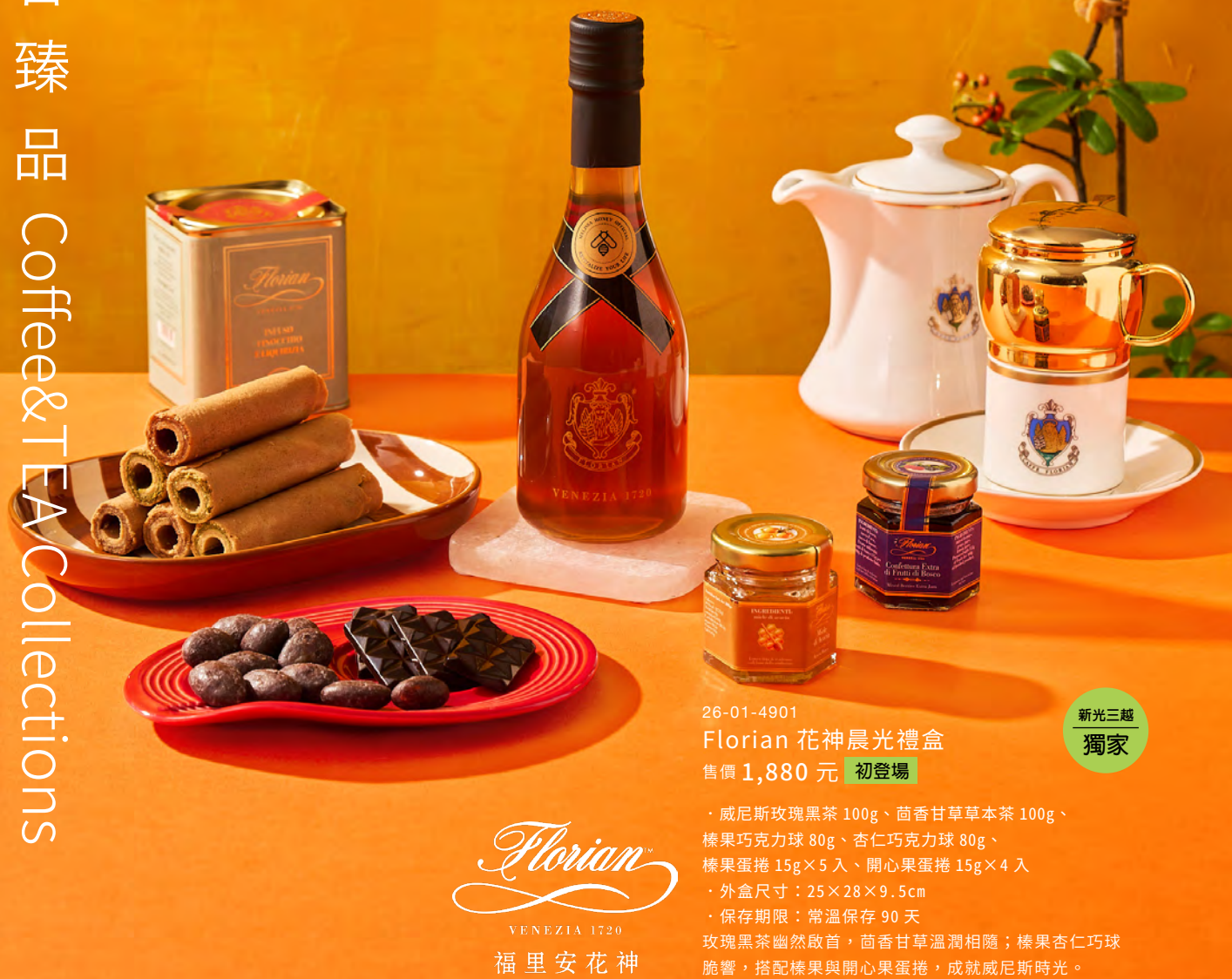
26-01-4901 Florian 花神晨光禮盒 售價 1,880 元 初登場

醇香臻品 Coffee&TEA collections 極致茗茶，精品咖啡，獻上節日最醇厚的心意。