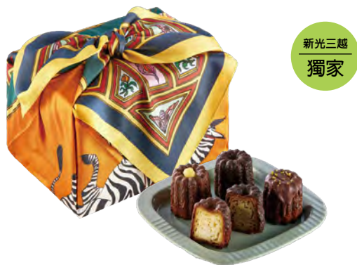
26-01-3903 TEA IN BED 可麗露 10 入絲巾禮盒 售價 1,680 元 初登場 (蛋奶素)