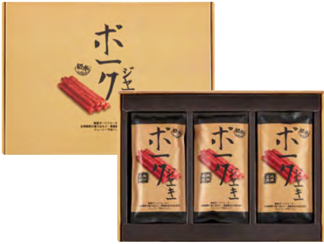
26-01-4601 初水 金馬迎春爆汁豬肉條禮盒 售價 799 元 初登場