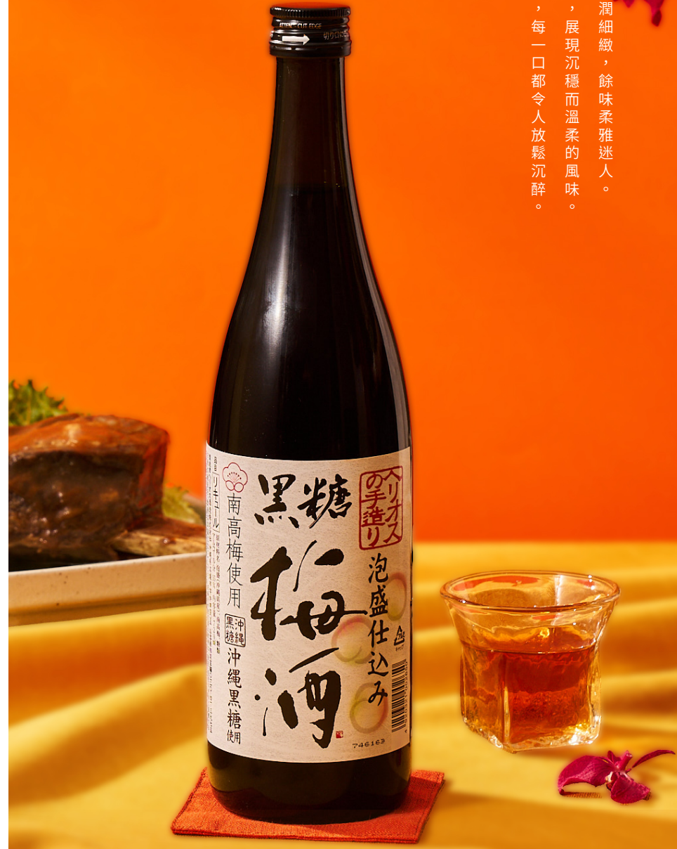
26-01-6404 沖繩手作黑糖梅酒 售價 1,080 元 初登場

· 容量：90ml×6 · 外盒尺寸：17.5×12.5×10.5cm · 酒精濃度：橡木桶釀造高級梅酒夢響 5 年熟成、 夢響鶯宿梅梅酒 3 年熟成、願梅酒 20% 1 年熟成， 天女羽根衣柚香酒 16%，嚴選南高梅梅酒 14% 3 年 熟成，香橙梅酒 12%· 產地：日本大分縣