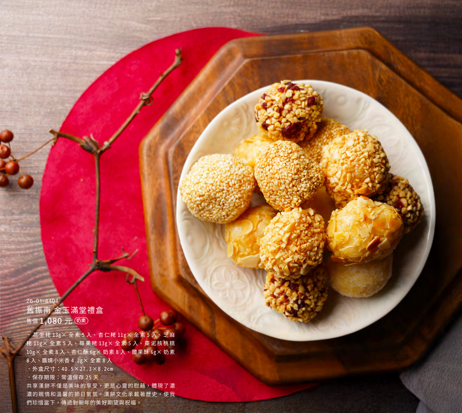
26-01-4401 舊振南 金玉滿堂禮盒 售價 1,080 元 (奶素)

・馬上招財造型餅乾、好事花生曲奇、福氣滿滿福字餅、鹽之花巧克力餅乾、小山園抹茶雪球、法式草莓夾心餅乾、百香芒果夾心餅乾、珍珠糖小泡芙、果汁馬林糖、香草堅果曲奇，約 460g/ 盒・外盒尺寸：16.5×14.5×5cm ・保存期限：常溫保存 20 天 台南私房訂製手工鐵盒餅乾，春節手繪專屬造型，日本製粉手工製作，極減糖配方，多款專屬口味，十全十美經典一次收藏。