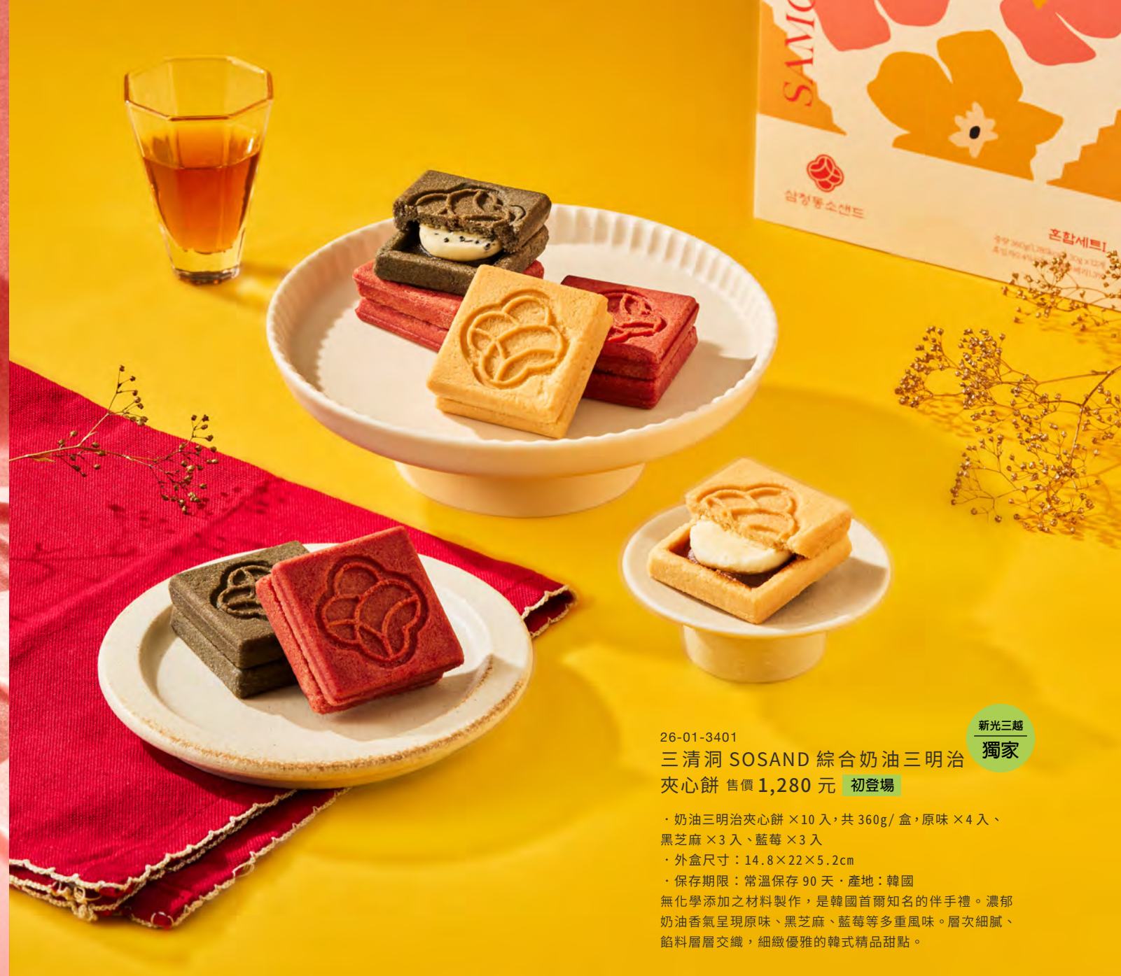
26-01-3401 三清洞 SOSAND 綜合奶油三明治夾心餅 獨家 售價 1,280 元 初登場