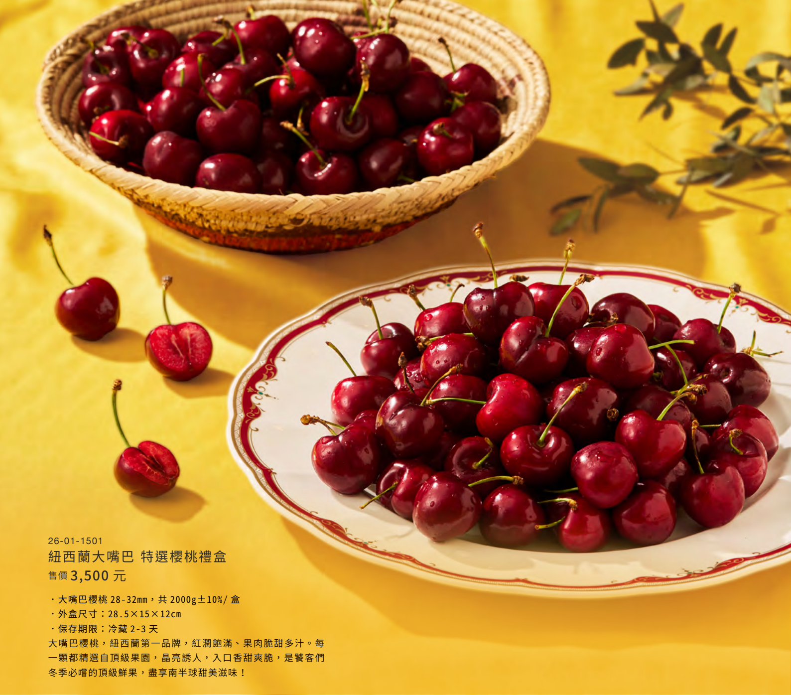
26-01-1501 紐西蘭大嘴巴 特選櫻桃禮盒 售價 3,500 元

・大嘴巴櫻桃 28-32mm，共 2000g±10%/ 盒 ・外盒尺寸：28.5×15×12cm ・保存期限：冷藏 2-3 天 大嘴巴櫻桃，紐西蘭第一品牌，紅潤飽滿、果肉脆甜多汁。每一顆都精選自頂級果園，晶亮誘人，入口香甜爽脆，是饕客們冬季必嚐的頂級鮮果，盡享南半球甜美滋味！