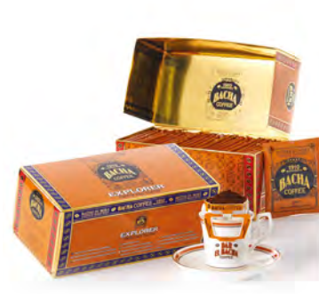
26-01-5002 探索經典掛耳咖啡袋品鑑禮盒 售價 1,700 元

· 咖啡 12g×12 袋，含包裝總重量 144g/ 盒 · 外盒尺寸：13×13×11cm · 保存期限：常溫保存 36 個月 恰似新鮮採摘的野草莓，搭配濃醇綿密的鮮奶 油，這杯咖啡讓人享受滿載趣味的仲夏假期。