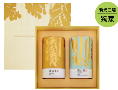
26-01-5202 晨露高山雙茶賞禮盒 售價 1,350 元