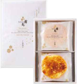
26-01-2301 金之鼎庵 手工米菓禮盒 售價 790 元 初登場 全素