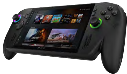
26-01-6902 ASUS ROG XBOX ALLY X 電競掌機 售價 27,999 元

ROG XBOX Ally X 是由 ROG 與 Xbox 合作推出的高階手持電競裝置，採用 Windows11 作業系統，屬於「掌上電腦+遊戲機」的混合型平台。其定位為「可攜帶但效能強大」的遊戲裝置、適合遊戲玩家想在手持裝置上執行 PC/Steam/Xbox 遊戲的情境。