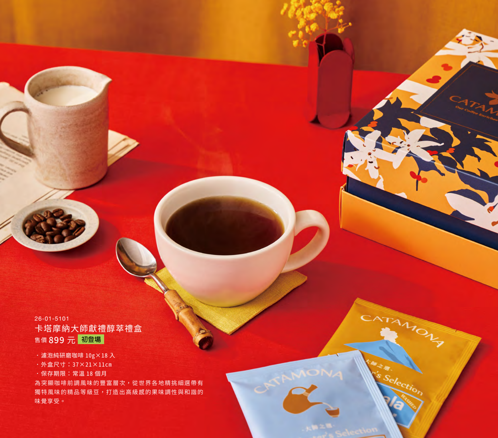
26-01-5101 卡塔摩納大師獻禮醇萃禮盒 售價 899 元 初登場