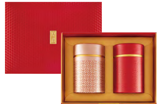
26-01-5204 奉茗堂高山紅玉厚禮禮盒 售價 1,260 元 初登場