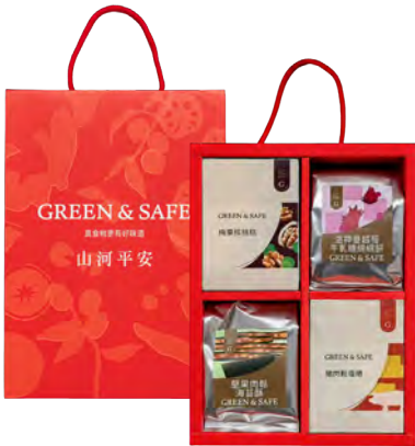
26-01-4606 永豐餘生技 山河平安禮盒 售價 800 元 初登場