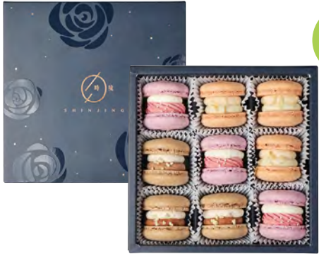
26-01-4503 時境 減糖厚餡馬卡龍 9 入 售價 649 元 初登場 蛋奶素