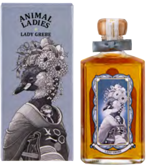
26-01-5804 動物夫人 小鵜鵜夫人 售價 7,800 元 初登場

· 容量：250ml×1 · 外盒尺寸：7×7×15cm · 酒精濃度：56.5% · 產地：台灣 此酒款口感溫潤飽滿，紅酒桶賦予飽滿櫻桃與黑醋栗風味，層層堆疊深色果香，尾段帶有可與辛香橡木調性，厚實且悠長。