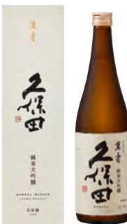
26-01-6304 久保田 萬壽 純米大吟釀 售價 3,100 元

· 容量：1000ml×1 · 外盒尺寸：10.5×10.5×39.5cm · 酒精濃度：16~17%· 產地：日本福井縣 耗時 5 年於零下 10°C 緩慢熟成，被評為一支完成度 非常高的純米大吟釀。 此酒款以低溫出廠，到貨後敬請冷藏保存。