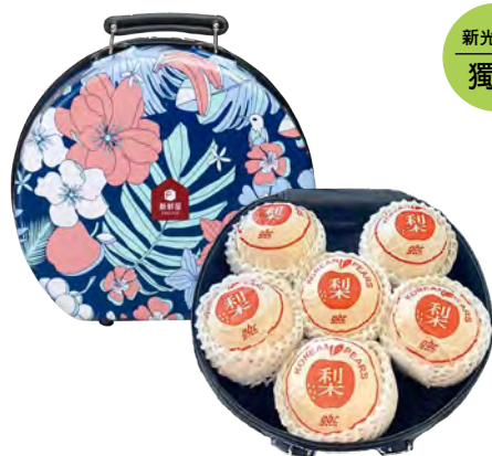
26-01-1405 果漾花箱韓國梨禮盒 售價 1,680 元