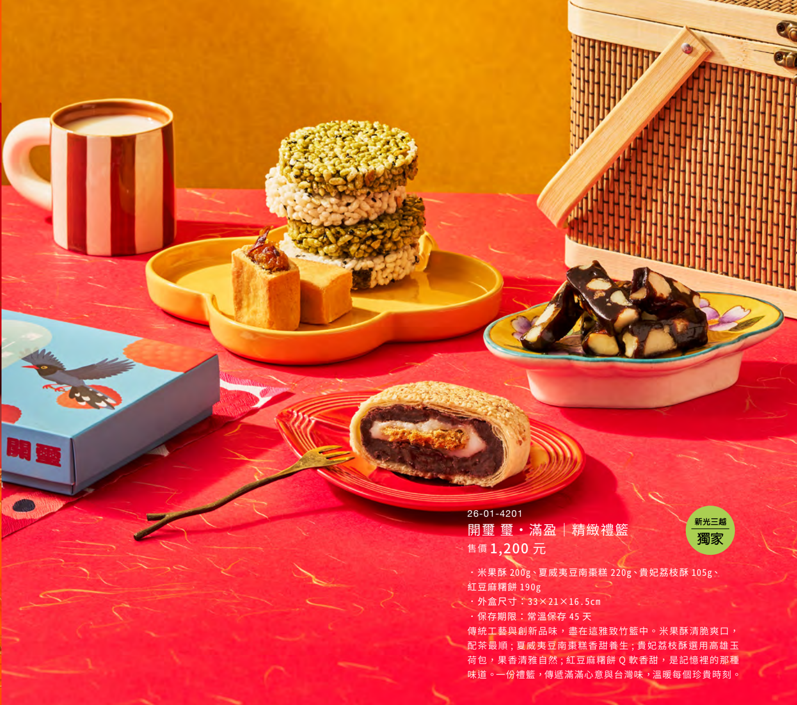
26-01-4201 開璽 璽・滿盈 | 精緻禮籃 售價 1,200 元