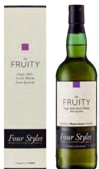
26-01-5405 蘇格蘭單一麥芽威士忌 Four Styles 水果香曼諾克摩 2012 售價 1,380 元

這款帶有鹹香泥煤的威士忌，透出黑巧克力和香草的氣息，非常適合搭配新年圍爐的海鮮大餐。