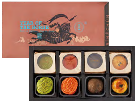
26-01-4402 日禾春 馬上封爵新春禮盒 售價 999 元 初登場

・紅心番石榴酥×5 入、亞麻仁原味鳳梨酥×5 入、松露牛軋糖×12 入，共 800g±3%/ 盒・外盒尺寸：26×18.5×6cm( 附提袋 ) ・保存期限：冷藏保存 20 天 選用台灣鳳梨及宜蘭小農製作紅心番石榴以法式烘焙手法製成糕餅，酸甜適中不膩口。金質獎松露牛軋糖長年銷售冠軍，濃郁松露香氣鹹甜風味 Q 軟不黏牙。