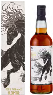
26-01-5805 北歐神話 駿馬 斯雷普尼爾 售價 4,350 元 初登場

· 容量：700ml×1 · 外盒尺寸：9×9×27cm · 酒精濃度：61% · 產地：日本茨城縣 此酒款帶有甜美的青蘋果與瓜果香、杏桃乾、香草、肉桂、荳蔻等香氣，有著青蘋果、水果軟糖、奶油、麥芽、香草、辛香料與木質的口感，以及清新果香、奶油、木質單寧與辛香料的尾韻。