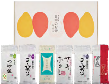
26-01-2305 KURIYA 栗屋 精選日本米禮盒 6 入 售價 1,090 元 初登場