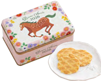
26-01-2403 L'espoir 新年限定 奶油薄煎餅 8 入 售價 420 元 初登場 蛋奶素