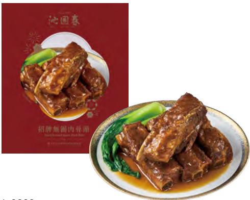
26-01-0802 沁園春 招牌無錫肉骨頭 售價 599 元 初登場 · 招牌無錫肉骨頭 400g (固形物 300g) / 盒 · 外盒尺寸：15×21×5cm · 保存期限：冷凍保存 365 天 以江浙菜「濃油赤醬」為底蘊，遵循炸、滷等繁瑣工序，讓肉質軟嫩不柴，輕咬即可骨肉分離，是世代傳承的經典功夫菜。