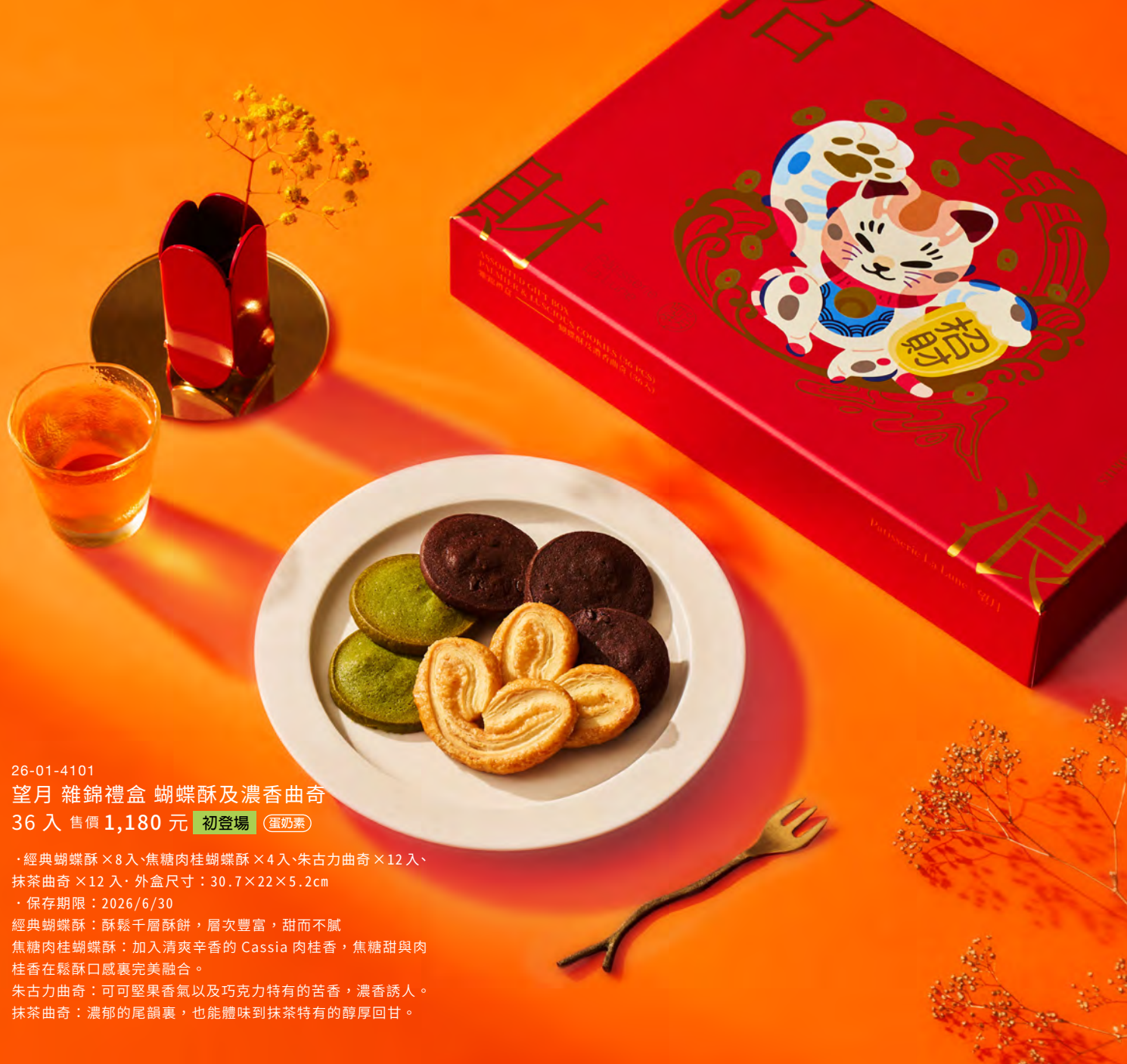
26-01-4101 望月 雜錦禮盒 蝴蝶酥及濃香曲奇 36 入 售價 1,180 元 初登場 (蛋奶素)