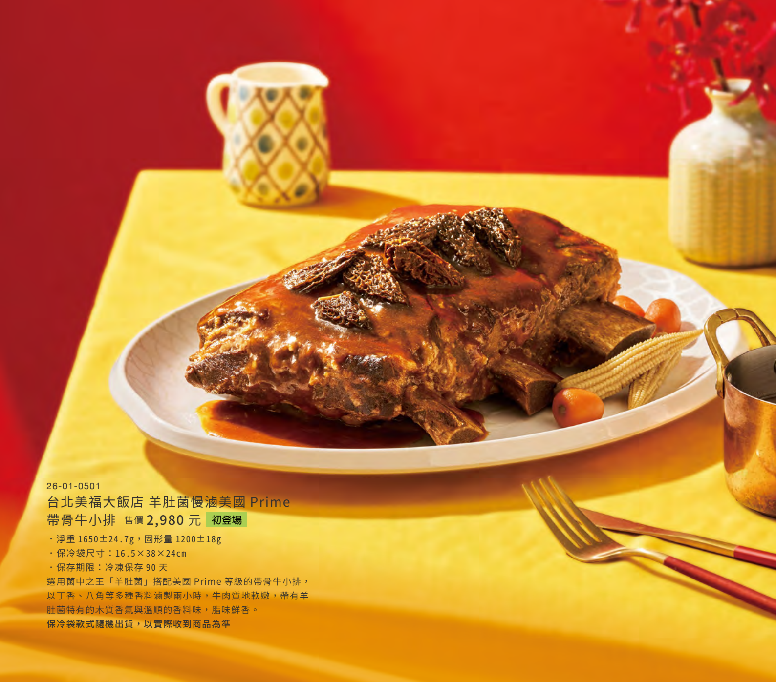
26-01-0501 台北美福大飯店 羊肚菌慢滷美國 Prime 帶骨牛小排 售價 2,980 元 初登場

・淨重 1650±24.7g，固形量 1200±18g ・保冷袋尺寸：16.5×38×24cm ・保存期限：冷凍保存 90 天 選用菌中之王「羊肚菌」搭配美國 Prime 等級的帶骨牛小排，以丁香、八角等多種香料滷製兩小時，牛肉質地軟嫩，帶有羊肚菌特有的木質香氣與溫順的香料味，脂味鮮香。 保冷袋款式隨機出貨，以實際收到商品為準