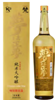
26-01-6303 梵 夢是正夢 純米大吟釀 1L 售價 8,800 元

· 容量：新生獺祭純米大吟釀 45 720ml×2 · 外盒尺寸：10.3×24.3×38cm · 酒精濃度：14%· 產地：日本山口縣 新生 45 為獺祭絕版品！新生系列是專注於發酵過程 所產生的「外泌體」產品。 此酒款以低溫出廠，到貨後敬請冷藏保存。