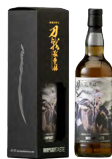
26-01-5601 Whisky Taste 霹靂·談無慾 單一麥芽威士忌 售價 1,980 元 初登場