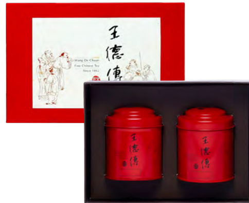
26-01-5205 德傳特選禮盒 售價 970 元