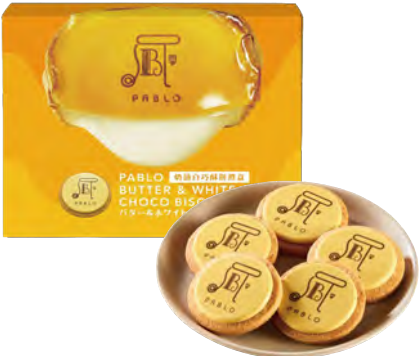
26-01-2303 PABLO 奶油白巧酥餅禮盒 (生乳風味) 售價 629 元 初登場 蛋奶素