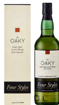
26-01-5406 蘇格蘭單一麥芽威士忌 Four Styles 木桶香奧斯魯斯克 2012 售價 1,380 元 初登場

口感濃郁而麥香飽滿，牛奶巧克力、香草、焦糖與甜麥芽的風味層次，於舌尖間綿延展開。