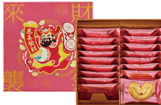
26-01-4103 望月 蝴蝶酥禮盒 經典蝴蝶酥 18 入 售價 720 元 初登場 (奶素)