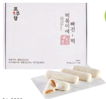
26-01-3502 母父堂 白玉芝麻蜜年糕 售價 680 元 初登場