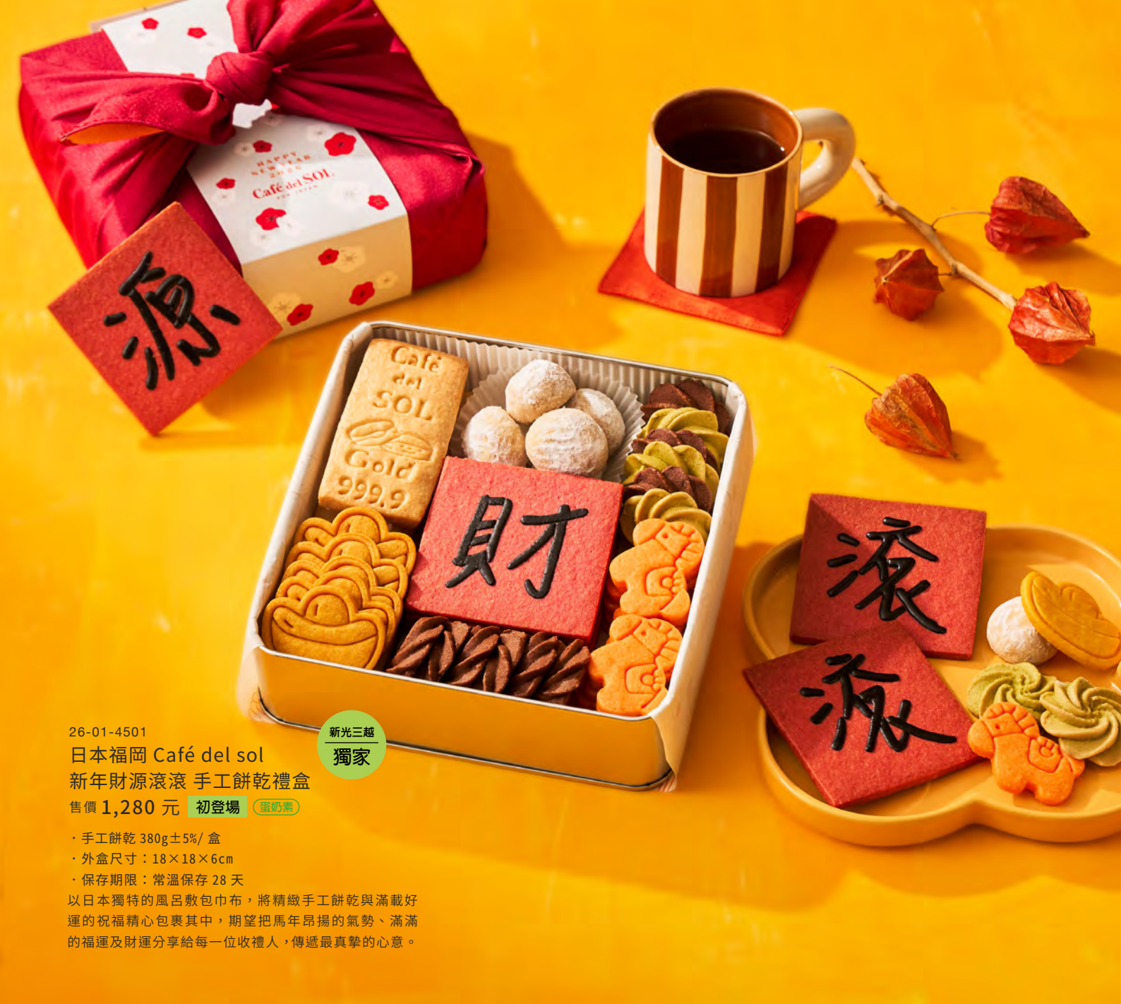
26-01-4501 日本福岡 Café del sol 新年財源滾滾 手工餅乾禮盒 售價 1,280 元 初登場 蛋奶素