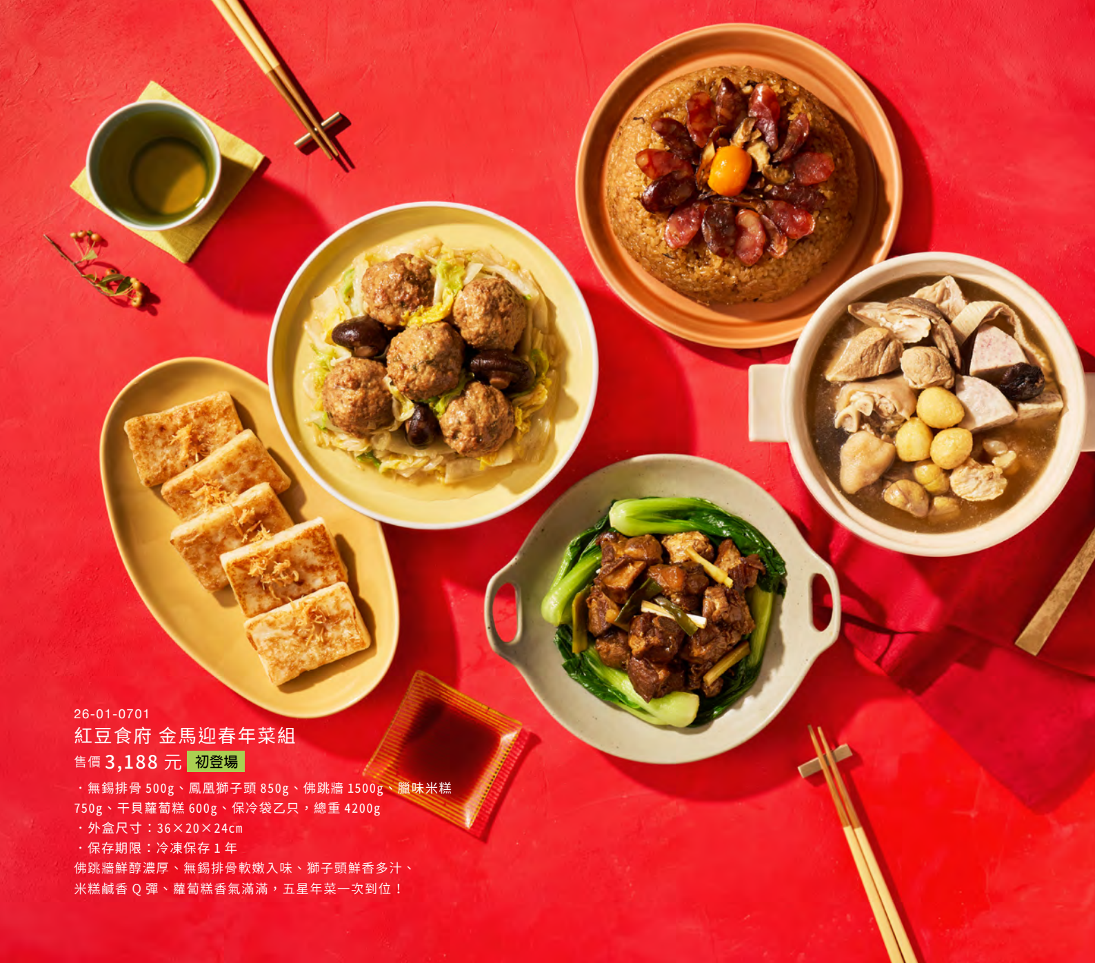
26-01-0701 紅豆食府 金馬迎春年菜組 售價 3,188 元 初登場 · 無錫排骨 500g、鳳凰獅子頭 850g、佛跳牆 1500g、臘味米糕 750g、干貝蘿蔔糕 600g、保冷袋乙只，總重 4200g · 外盒尺寸：36×20×24cm · 保存期限：冷凍保存 1 年 佛跳牆鮮醇濃厚、無錫排骨軟嫩入味、獅子頭鮮香多汁、米糕鹹香 Q 彈、蘿蔔糕香氣滿滿，五星年菜一次到位！