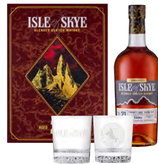
26-01-5401 天空之島 21 年蘇格蘭威士忌新年禮盒 售價 2,380 元

· 容量：700ml×1 · 威士忌×2 · 外盒尺寸：22.5×10×31cm · 酒精濃度：40% · 產地：英國 天空之島 21 年融合雪莉與橡木桶陳釀，帶出濃郁果乾、蜂蜜、太妃糖與淡雅煙燻風味，口感醇厚平衡，展現歲月優雅層次。