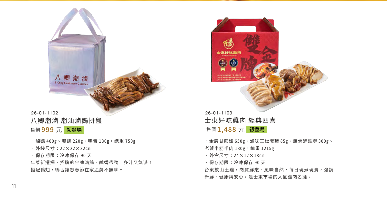
26-01-1102 八卿潮滷 潮汕滷鵝拼盤 售價 999 元 初登場

· 經典台式蘿蔔糕 600g、古早鹹甜年糕 700g、 · 馥桂花香年糕 700g、阿嬤手作芋粿巧 (8 片入) 600g · 外盒尺寸：28×19.5×16cm · 保存期限：冷凍保存 9~12 個月 迪化街一甲子老粿行，蘿蔔糕、年糕、芋粿巧，共四款經典商品，年菜必備首選，古法手作，闔家皆宜，再贈保冷袋。