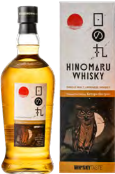
26-01-5803 日之丸台灣貓頭鷹黃魚鴉單桶原酒 售價 4,680 元 初登場

· 容量：700ml×1 · 外盒尺寸：9×9×29cm · 酒精濃度：50% · 產地：日本福岡縣 新道蒸溜所的威士忌藍圖之初，充分展現了新道特色的奶香（Milky）、油脂感（Fatty）、太妃糖風味（Toffee）將此作為第一隻日本單一麥芽威士忌！