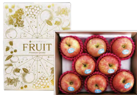
26-01-1401 日本青森 陽光富士蘋果禮盒 售價 1,380 元