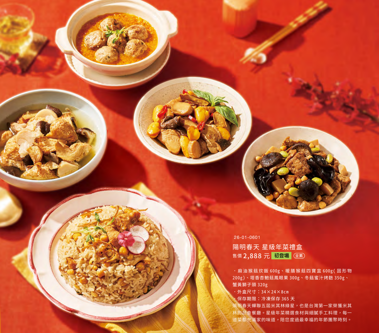
26-01-0601 陽明春天 星級年菜禮盒 售價 2,888 元 初登場 全素

・淨重 1650±24.7g，固形量 1200±18g ・保冷袋尺寸：16.5×38×24cm ・保存期限：冷凍保存 90 天 選用菌中之王「羊肚菌」搭配美國 Prime 等級的帶骨牛小排，以丁香、八角等多種香料滷製兩小時，牛肉質地軟嫩，帶有羊肚菌特有的木質香氣與溫順的香料味，脂味鮮香。 保冷袋款式隨機出貨，以實際收到商品為準