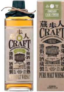
26-01-5602 千代結蔵歩人純麥威士忌梅酒 樽後熟 售價 1,880 元 初登場