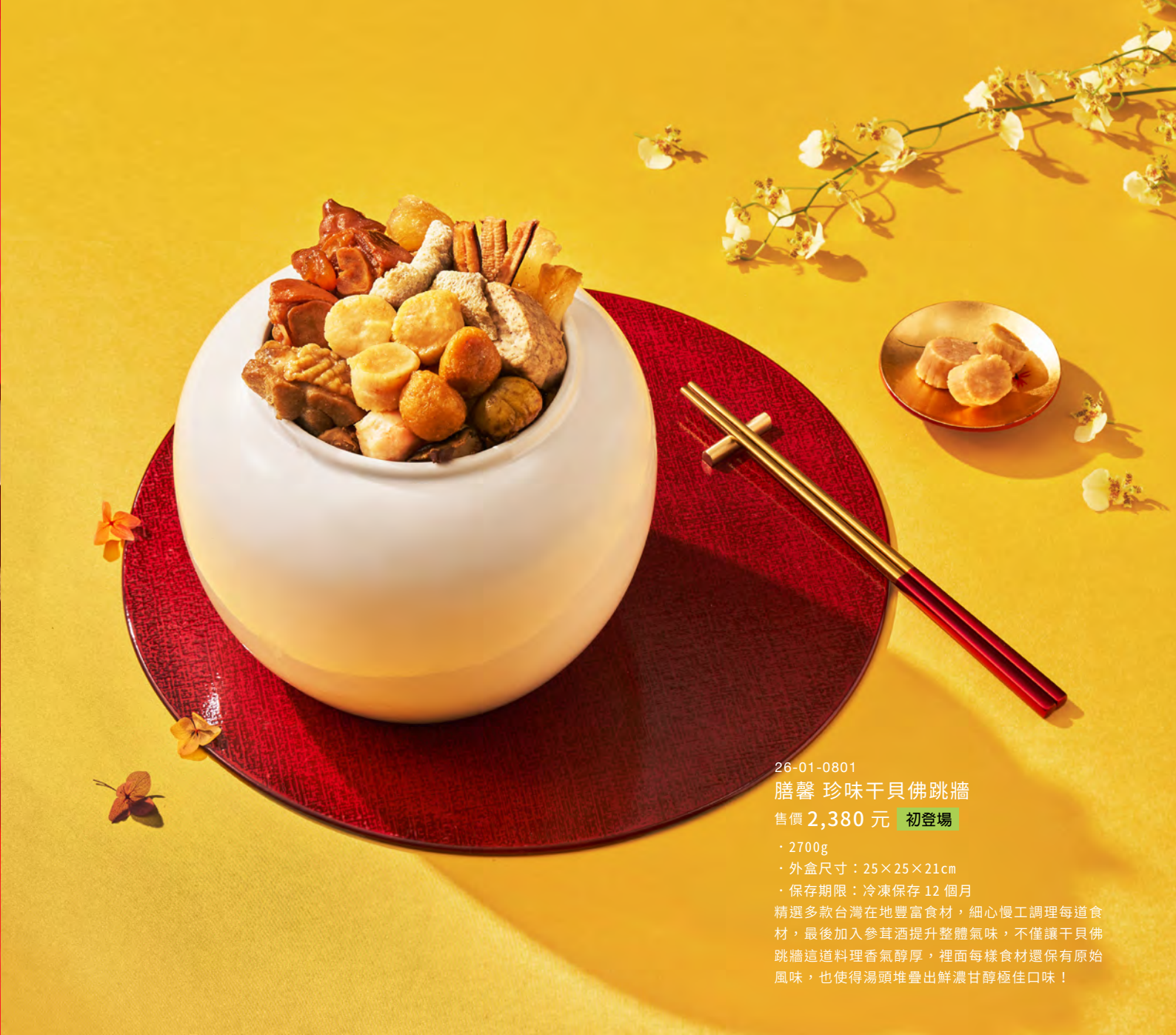
26-01-0801 膳馨 珍味干貝佛跳牆 售價 2,380 元 初登場 · 2700g · 外盒尺寸：25×25×21cm · 保存期限：冷凍保存 12 個月 精選多款台灣在地豐富食材，細心慢工調理每道食材，最後加入參茸酒提升整體氣味，不僅讓干貝佛跳牆這道料理香氣醇厚，裡面每樣食材還保有原始風味，也使得湯頭堆疊出鮮濃甘醇極佳口味！