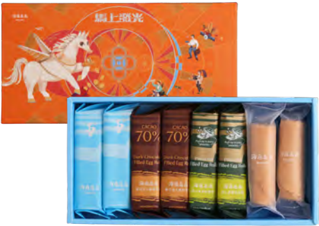
26-01-4502 海邊走走 海有福綜合蛋捲 售價 580 元 初登場 蛋奶素