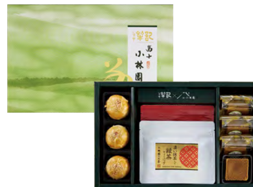
26-01-4202 台中犁記 X 富士山小林園聯名款 森山嵐禮盒 售價 1,200 元 初登場 (蛋奶素)