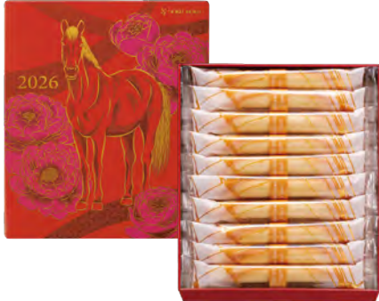
26-01-2404 YOKU MOKU 【新年限定】雪茄蛋捲禮盒 30 入 售價 1,320 元 初登場 蛋奶素