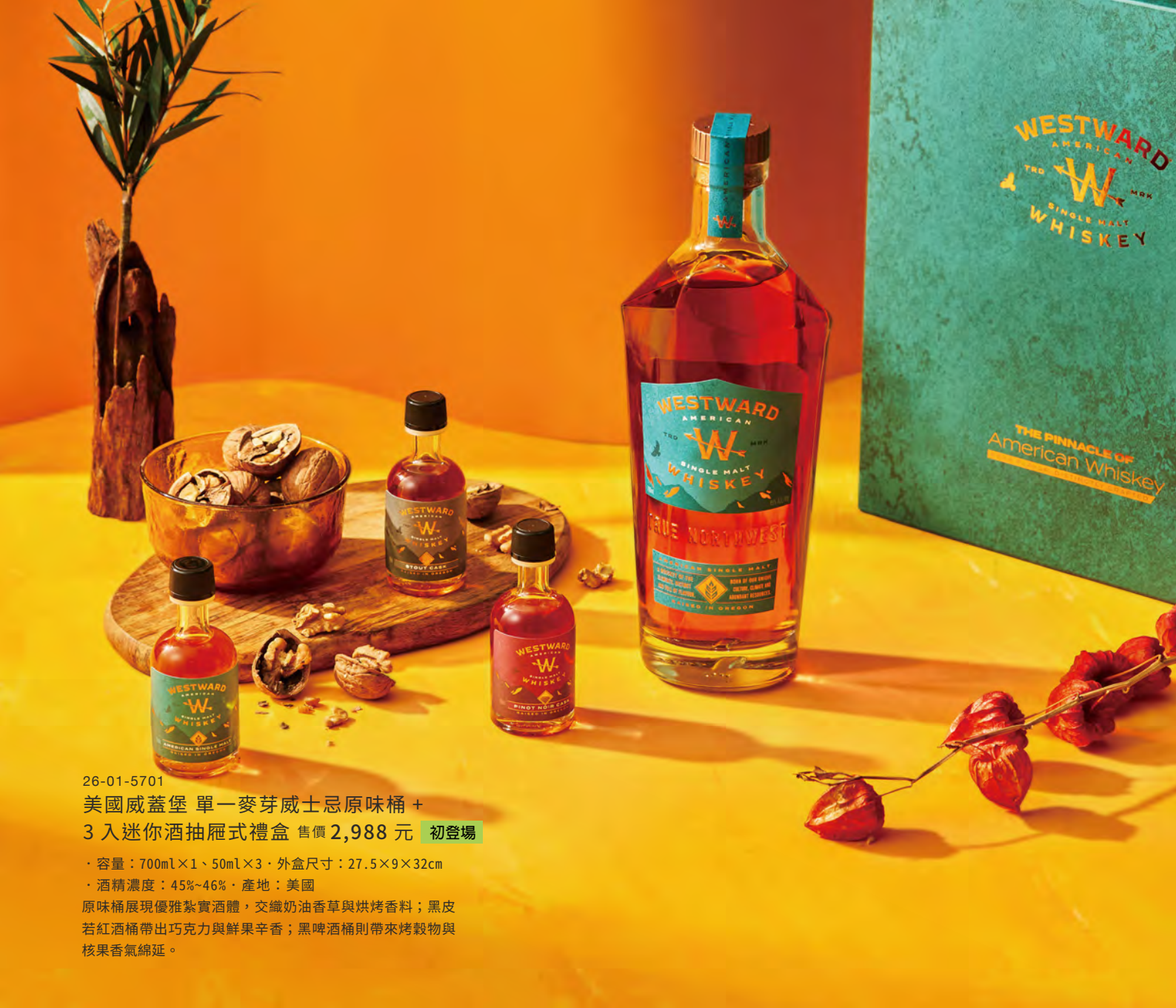
26-01-5701 美國威蓋堡 單一麥芽威士忌原味桶 + 3 入迷你酒抽屜式禮盒 售價 2,988 元 初登場

· 容量：700ml×1、50ml×3 · 外盒尺寸：27.5×9×32cm · 酒精濃度：45%~46% · 產地：美國 原味桶展現優雅紮實酒體，交織奶油香草與烘烤香料；黑皮若紅酒桶帶出巧克力與鮮果辛香；黑啤酒桶則帶來烤穀物與核果香氣綿延。