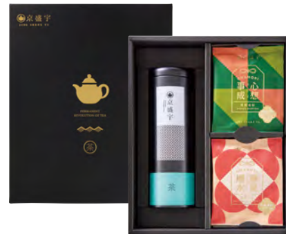
26-01-5203 京盛宇墨金雙享禮盒 售價 1,150 元