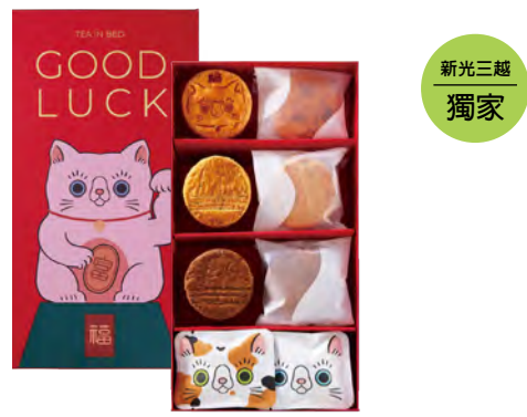
26-01-4002 TEA IN BED 招財貓布列塔尼茶包 公益禮盒 16 入 售價 1,280 元 初登場 (蛋奶素)