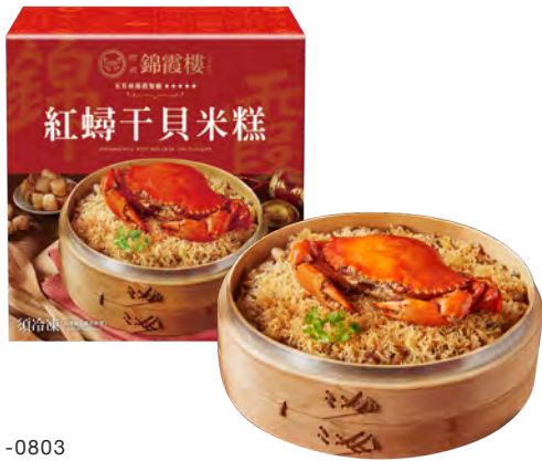
26-01-0803 錦霞樓 紅蟳干貝米糕 售價 899 元 初登場 · 紅蟳干貝米糕 900g/ 盒 · 外盒尺寸：24.5×12×24.5cm · 保存期限：冷凍保存 365 天 長糯米的香 Q 與紅蟳的鮮甜，再加上滑嫩的豬肉、鮮香的香菇，以及微微脆口的花生，層次感豐富，讓您一吃成主顧。