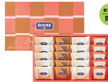
26-01-3603 ECHIRE 巴黎貝甜艾許貓舌餅 售價 980 元 初登場 (蛋奶素)