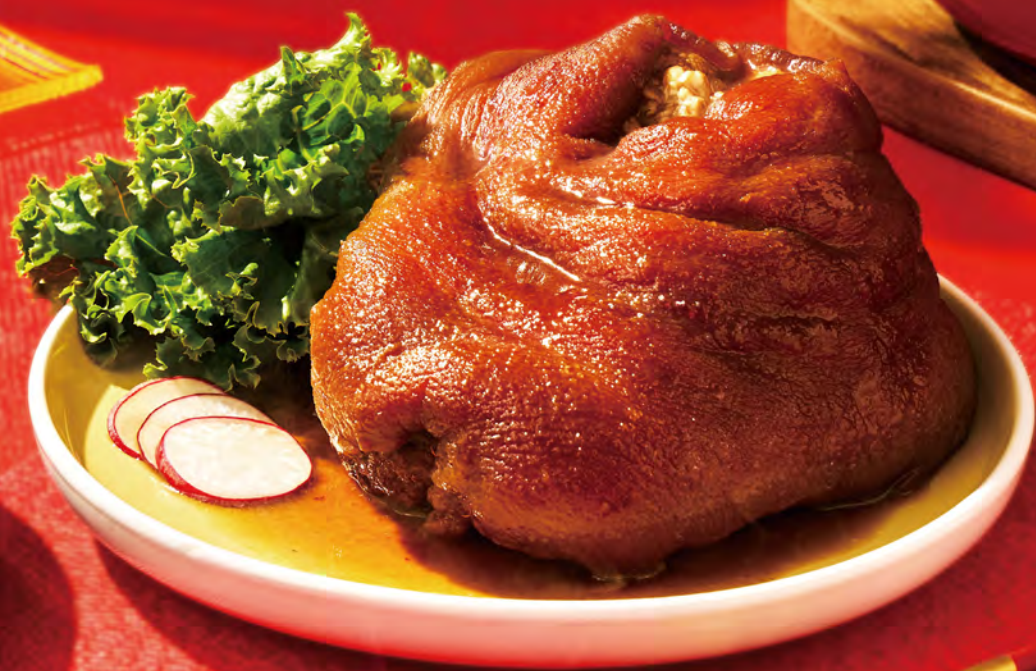
台北美福大飯店 紅麴滷蹄膀