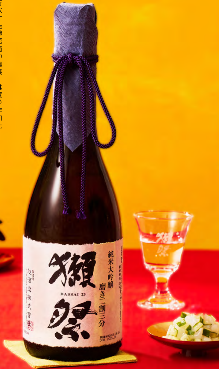
26-01-6301 獺祭 經典獺祭禮盒 售價 3,380 元

吟釀酒的世界常被認為必須要是行家才能體悟箇中奧義，其實並非如此。 真正的美酒，是任誰都能品鑑出來的。 獺祭以釀造真正的美酒為宗旨而努力不息。